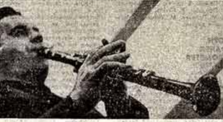
проникнул весь спектакль, не оставит равнодушным зрителя.

Шаг репетиция спектакля, который готовит к 50-летию Октября