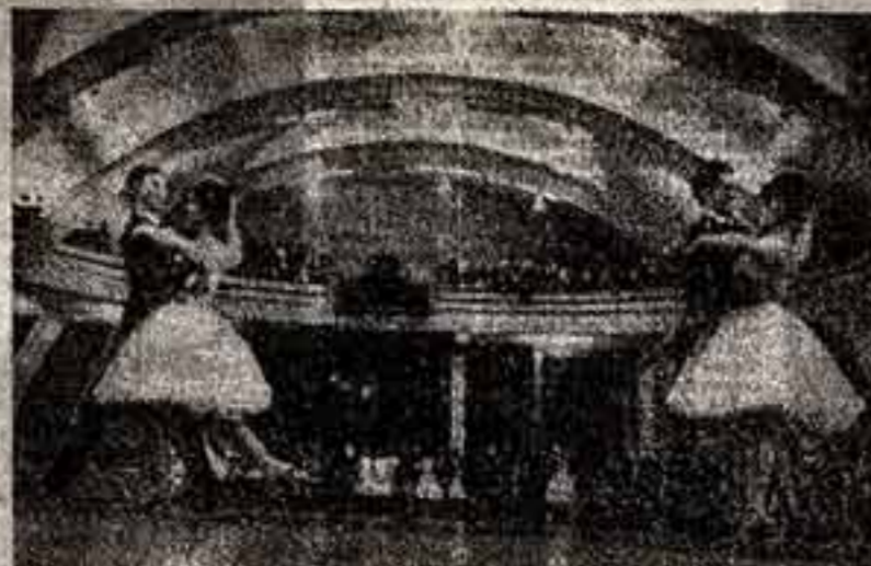
Спортивный зал Новосибирска «Динамо» заполнен девушками в пыльных белых платьях и юнцами в строгих черных костюмах...