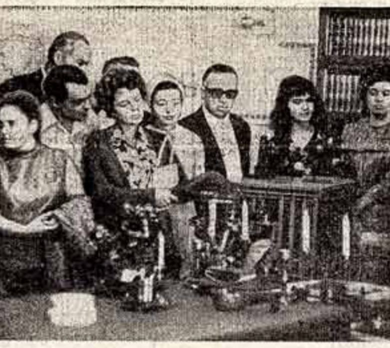
Группа участников и гостей VII Международного кинофестиваля — в Кремле, в рабочем кабинете В. И. Ленина.