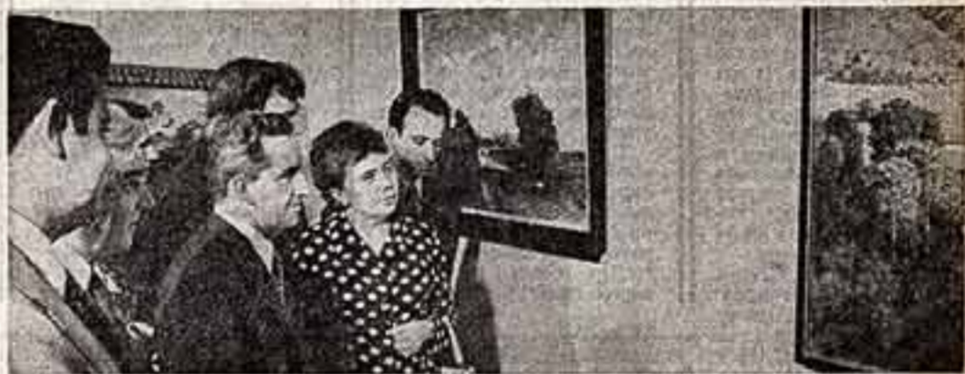
ЛЕНИНГРАД. В залах Государственного Эрмитажа открыта выставка «Изобразительное искусство Кубы». В экспозиции — живопись, графика, плакат.

Дни культуры Республики Куба в Советском Союзе