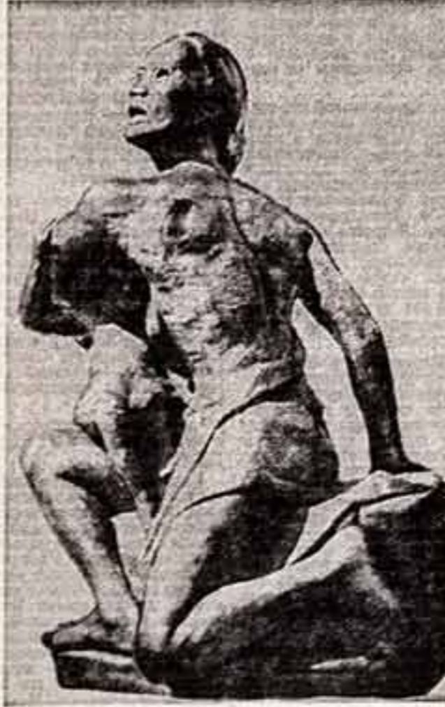
Роберт Экинс. «Женщина из Харфорда».

Он рассказал о своем роде от радозного члена партии, когда в годы гражданской войны в Испании он еще не дошел до выступления в бригаду Линкольна, до партийного руководителя сейчас. В этот период он познакомился с Этти Лойзер. Молодые, убежденные и лю-