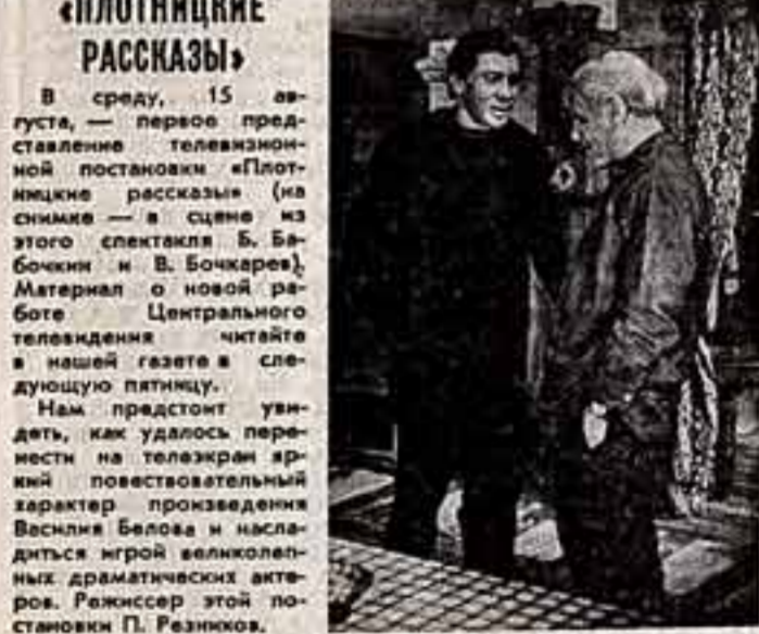
«ПЛОТНИЧКИЕ РАССКАЗЫ» В среду, 15 августа, — первое представление телевизионного постановки «Плотничьи рассказы»...