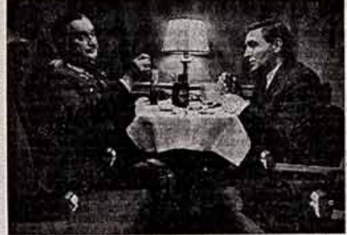
Сегодня — перед премьерой в волнующую так же, как и 25 лет назад, когда в 1948 году выходила на экраны мой первый фильм...