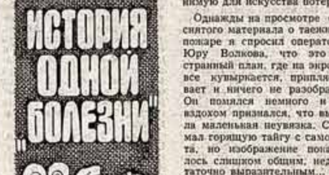
ИЗ БЛОКНОТА СЦЕНАРИСТА

— Да, — только что здесь... Ах, мать честная! Такие блочки, представляете, на море, и дятло... Против дятла, конечно, можно было бы еще и возражать.