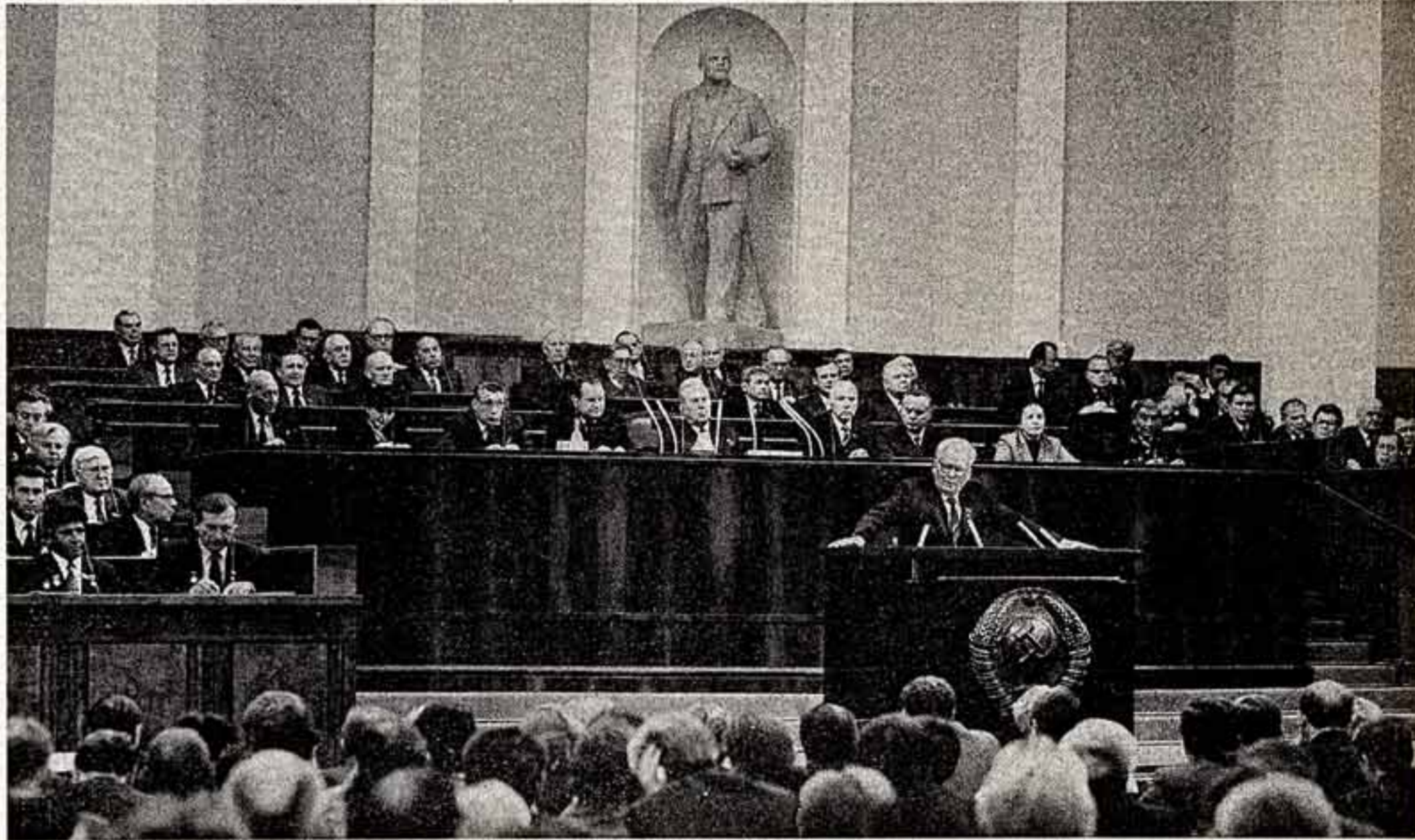
Во время Всесоюзного совещания народных контролеров. На трибуне — Генеральный секретарь ЦК КПСС, Председатель Президиума Верховного Совета СССР К. У. Черненко.

На заседании Политбюро ЦК рассмотрено также ряд других вопросов внутренней и внешней политики Советского Союза.