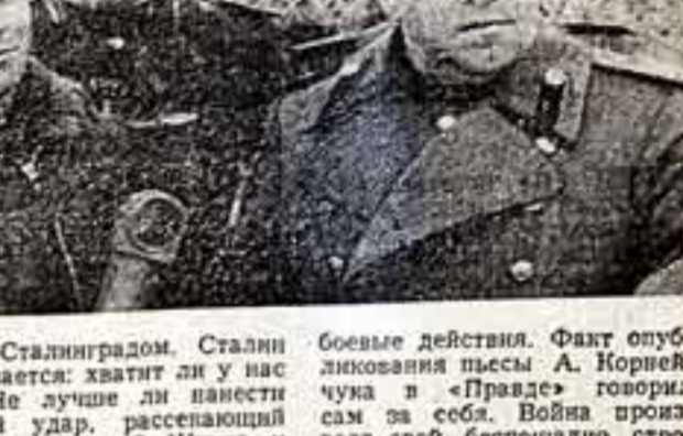
Кадр из фильма «Наследство».