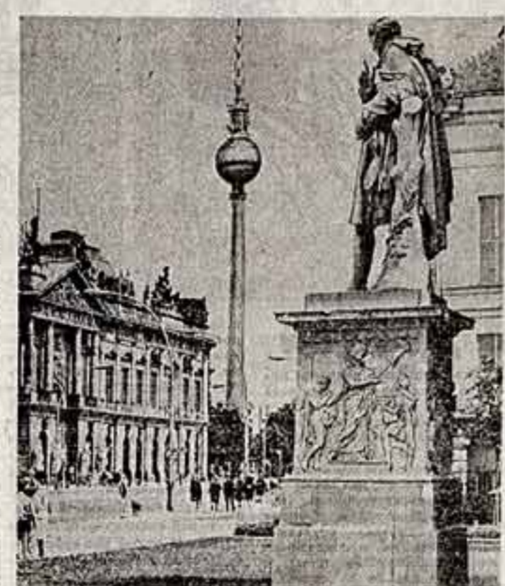
Там, где попирают права человека

ДЛЯ развития социалистической немечья национальной культуры характерна тесная связь с культурами братских социалистических стран, прежде всего с культурой СССР. Освободительная миссия Советской Армии в мае 1945 года была одновременно и культурной миссией первооткрывателя. И если с тех пор на нашей земле немалыми ни одна глубокая социальная пе-