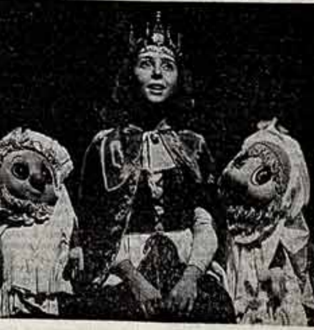
Кадр из фильма «Наследство».