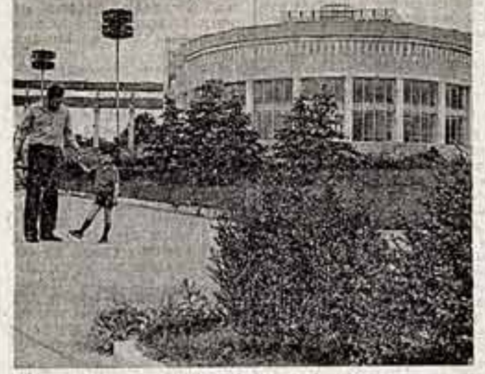
В Новосибирске в рамках реализации лекционной и танцевальной программы «Сибирь» в районном центре города Жашнова Черной области открылась новая библиотека.

В Новосибирске на всеобщую научно-практическую конференцию «Программа «Сибирь» и роль средств массовой информации в ее реализации» наши корреспонденты О. Александрова и М. Бримиан встречались со многими учеными.