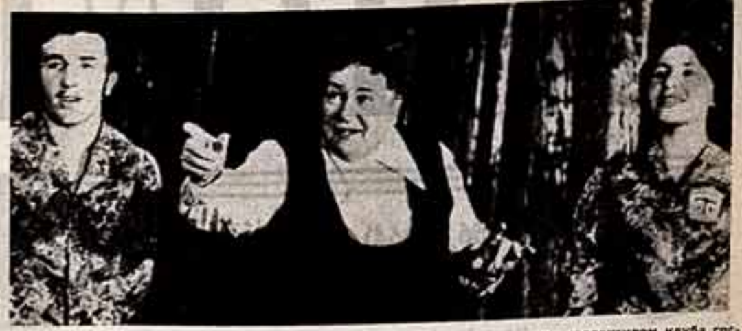
Более 20 лет руководит агитколлективом клуба го- товской области. Солнцы хоро и музеев фольклорный квартет представляли творчески на Неделе дружбы в Финляндии. Недавно самодеятельному академическому хору за многолетнюю и активную работу по эстетическому воспитанию трудящихся за большую и плодотворную пропаганду хорошего искусства присвоено звание народного.

Ю. ЛЕОНОВ, председатель Всесоюзного объединения «Международная книга».