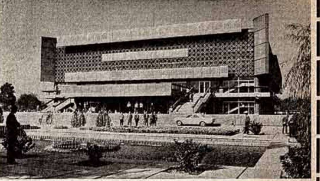
Всего год новому Дому политпросвещения в Душанбе. Достопримечательность его — кабинет технических средств пропаганды. Здесь создан целый комплекс для отработки лекторского мастерства. Кинопередвижная, диапроектор, магнитофон, радиоприемник и другая аппаратура позволяют значительно улучшить качество лекций и семинаров.

● Новый Дом политпросвещения в Душанбе.