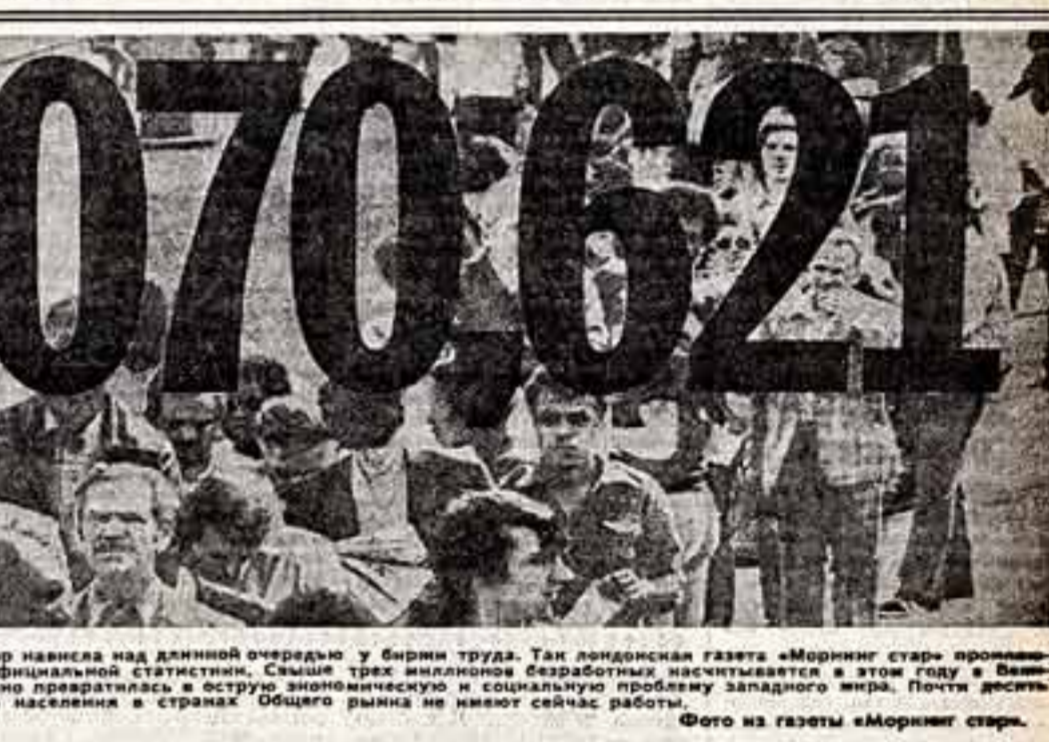
Мрачная тень семилетних цифр нависла над длинной очередью у биржи труда. Там лондонская газета «Морнинг стар» проанализировала данные британской официальной статистики. Больше трех миллионов безработных насчитывается в этом году в Великобритании. Вера в то, что ситуация изменится к лучшему, почти отсутствует.

Мондьян в Лондоне. Матисс и Палини побили на днях два рекорда. Одно из полотен Мондьяна, датированное 1912 годом, было продано на аукционе за немалую сумму — шестьдесят тысяч фунтов стерлингов. Картина Матисса, на которой изображены букеты цветов, пошла на аукцион за 4,8 миллиона франков — тоже рекорд для Франции. Матисс и Палини побили на днях два рекорда. Одно из полотен Мондьяна, датированное 1912 годом, было продано на аукционе за немалую сумму — шестьдесят тысяч фунтов стерлингов. Картина Матисса, на которой изображены букеты цветов, пошла на аукцион за 4,8 миллиона франков — тоже рекорд для Франции.