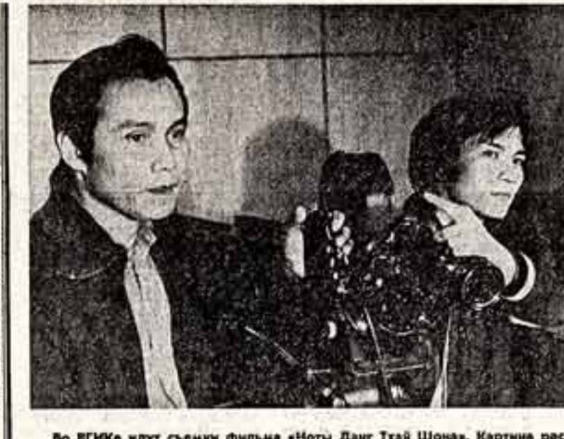
Во ВГИКе идут съемки фильма «Ноты Дант Шона». Картина рассказывает о вьетнамском пианисте Данте Шоне, лауреате X Международного конкурса пианистов имени Фридриха Шопена в Польше.

Сейчас театр работает над оперой А. Даргомыжского «Русалка» и готовит общенациональную премьеру, посвященную 60-летию образования СССР.