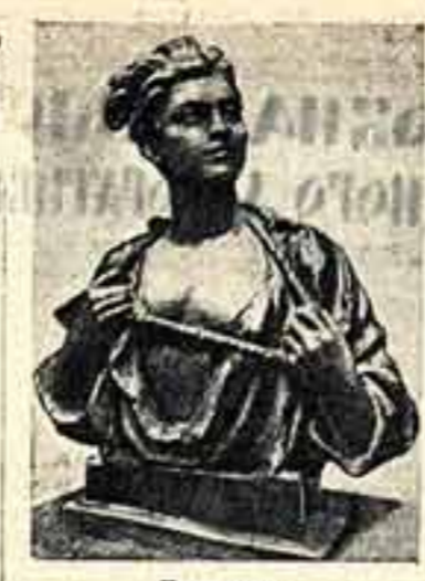
Скульптура И. РАШПОПТА. Ветераны в Троицком зале, в галереях в Троицком зале.