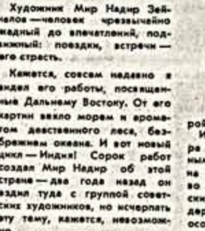
Художник Мир Надир Зейнелов — человек чрезвычайно гадкий до впечатлений, подвижный: повздки, встречи — его страсть.