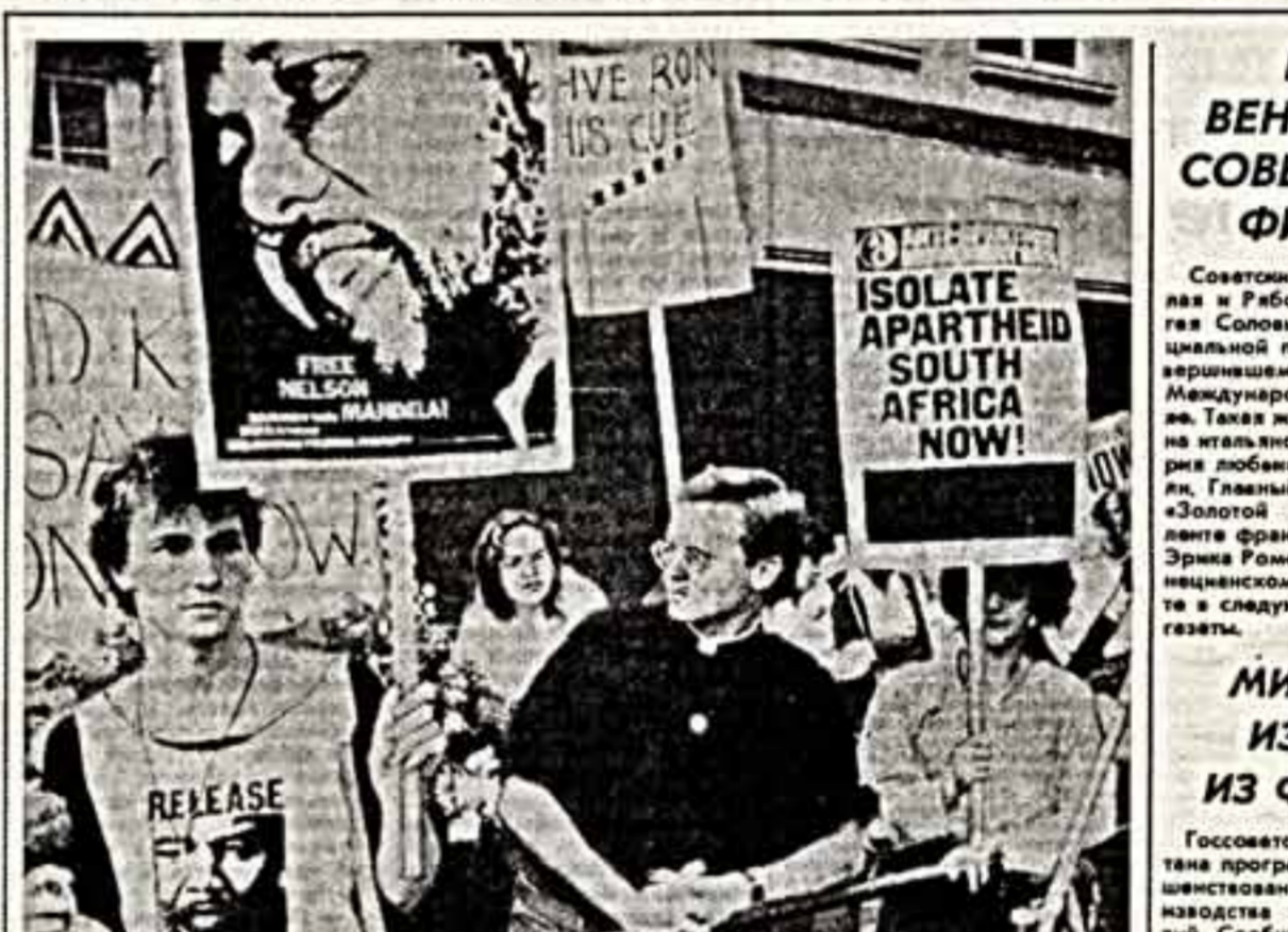
Не смекает голос общественности, требующий действенных санкций против режима апартаида в ЮАР. Псевдосатирическое правительство США и Великобритания не могут обмолвиться, что понимают, что это не имеет никакого воздействия на политическое положение в ЮАР. Страна, которую называют «государственной тюрьмой».

КАБУЛ. Выставлен юнг из фондов Государственной библиотеки СССР имени В. И. Ленина в Афганистане. Это демократическое Афганистана. В экспозиции, развернутой в помещении Кабульской государственной библиотеки, выставлено 150 томов на русском языке и 150 картин и плакатов, изданных в последние годы. Выставлены списки писателей и любителей книги. Особое внимание уделено патристичному и культурно-тематическому, художественному и детской литературе.