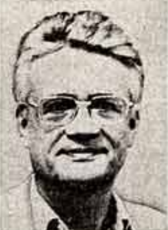
Жан-Мари Легэ (Франция)