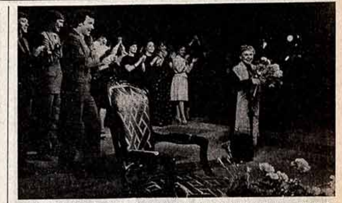
Театральный актер народного артиста СССР, лауреата Государственной премии РСФСР имени Г. Державина, артист в Московском театре юного зрителя. Более чем тридцатилетняя театральная жизнь артиста связана с этим театром.