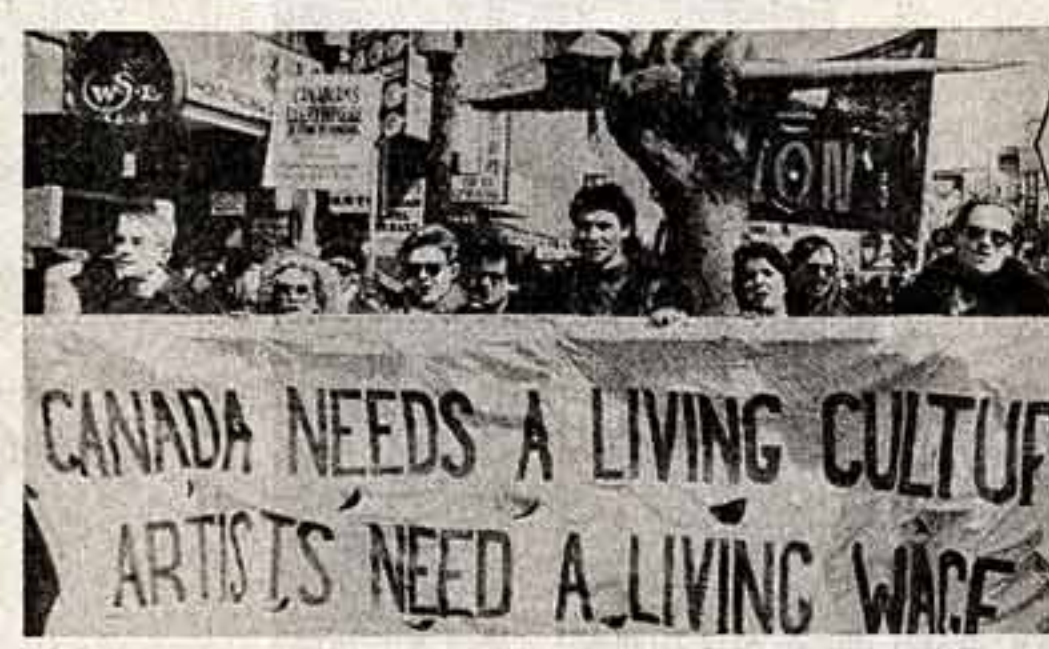
В Оттаве состоялась демонстрация работников культурно-просветительных учреждений Канады, выступивших с решительной критикой курса консервативного правительства страны на наращивание военных расходов за счет сокращения ассигнований на социально-экономические программы и, в частности, на развитие национальной культуры.

МЕХИКО. Союз левых сил Мексики призвал трудящихся провести перломийский праздник как день борьбы в защиту независимости и национально-освободительной борьбы трудящихся народов США. Левые партии призвали рабочий класс Мексики выйти на демонстрации также под лозунгами отпора попыткам местной буржуазии переломить на плечи народных масс бремя экономического кризиса.