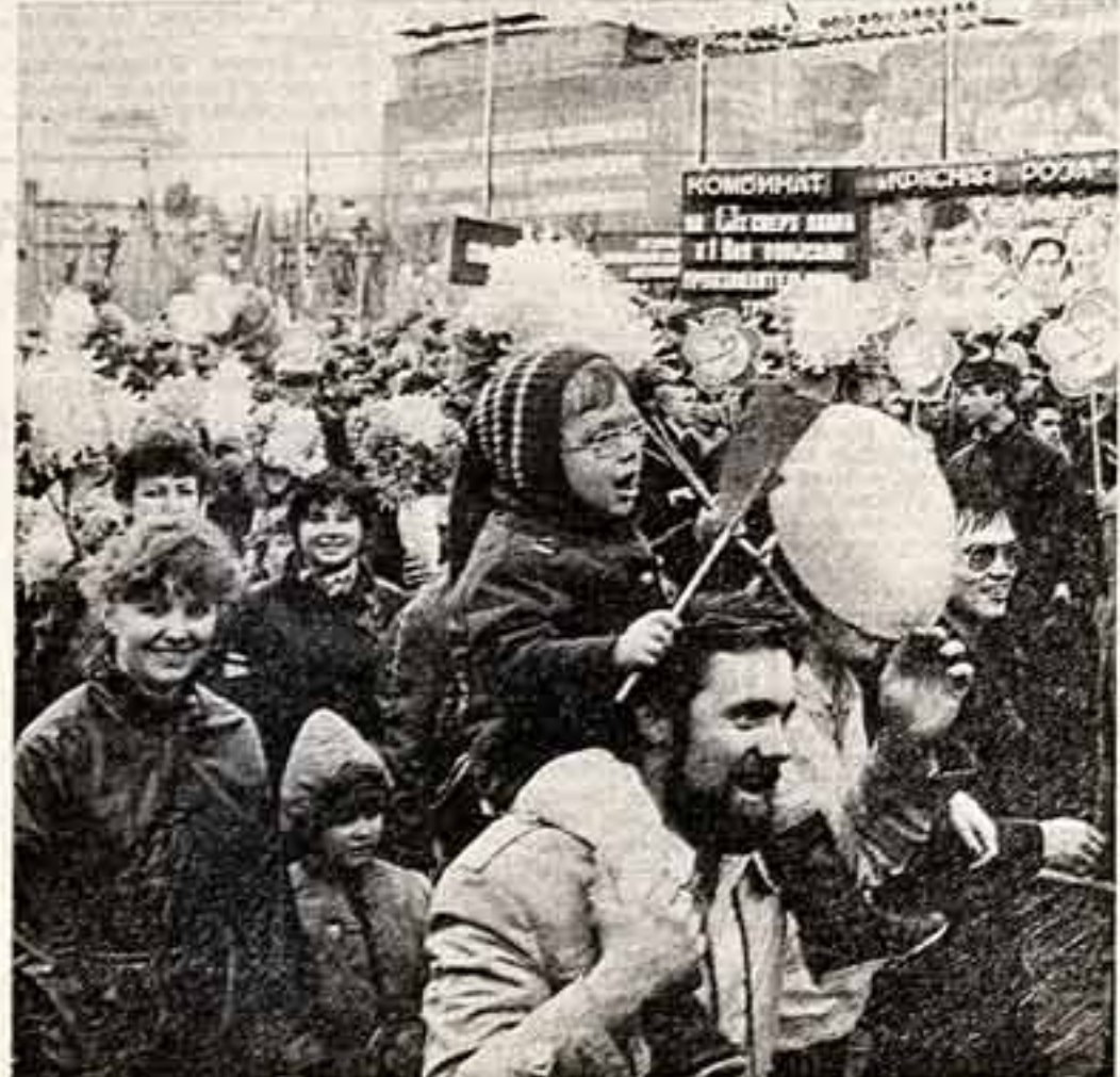
На Красной площади.

представлены произведения авторов разных поколений, отражает героические подвиги казахстанцев на фронтах и в тылу, трудовую и ратную доблесть наших современников, призывает к борьбе за мир. С выставкой ознакомился член Политбюро ЦК КПСС, первый секретарь ЦК Компартии Казахстана Д. А. Кунаев. (ТАСС).