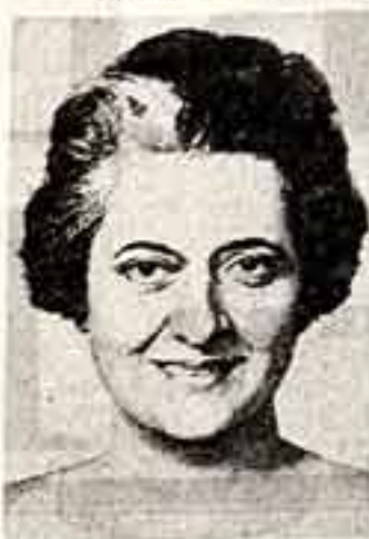
Индра Ганди (Индия)