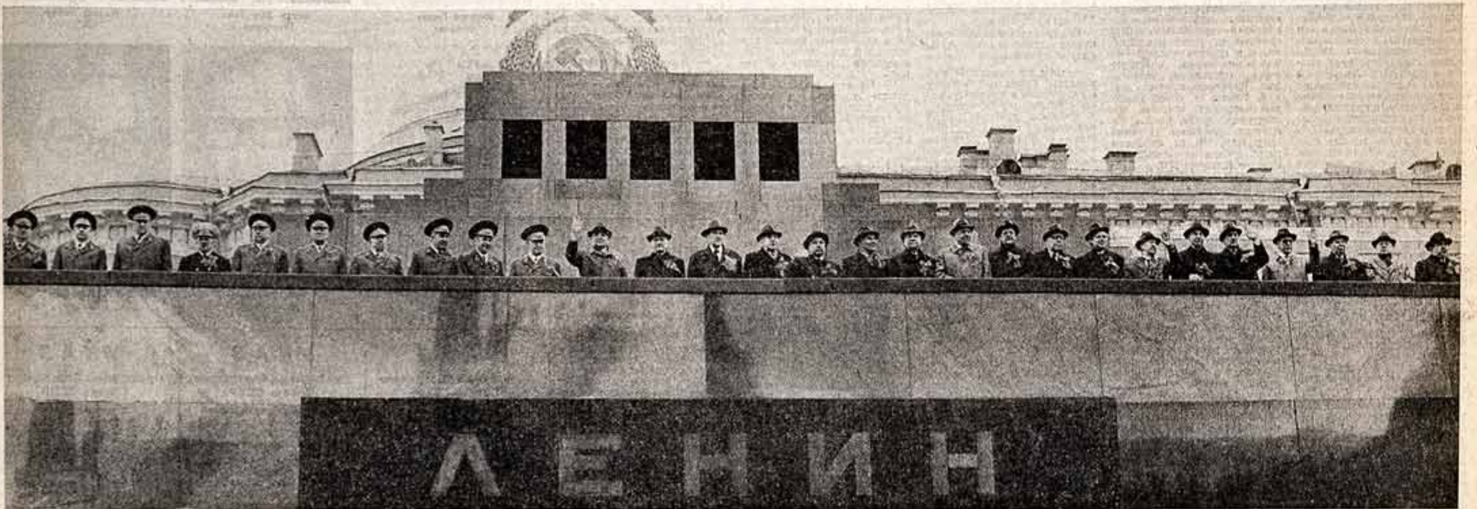
Москва, Красная площадь. 1 Мая 1985 г.