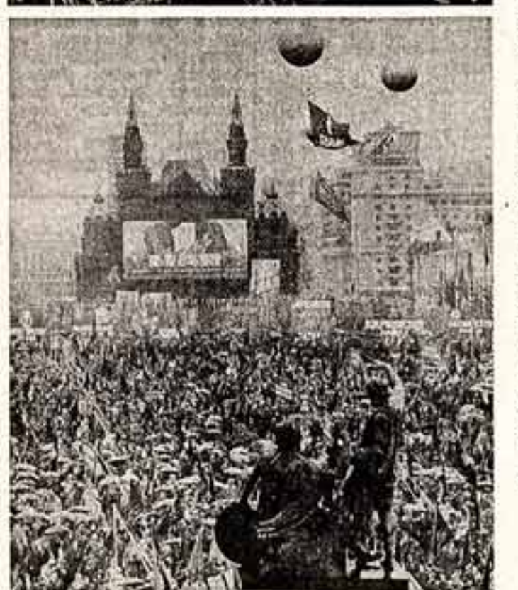
1 Мая 1985 года. На Красной площади.

Расцвели яблонь и груш, Поплыли туманы над рекой, Выглядит на берег Катюша, На высокий берег,