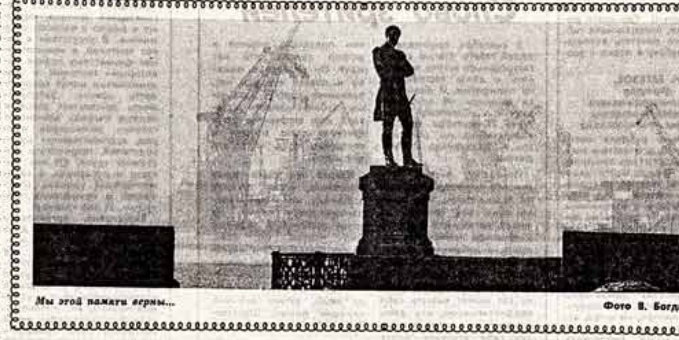
Мя этой памяти верны...