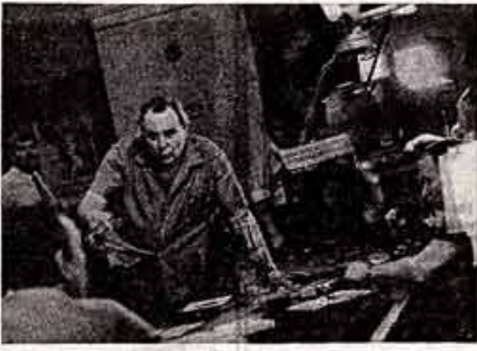
Народного артиста СССР Е. Матвееву можно встретить сейчас в павильонах «Мосфильма», где он в качестве режиссера ставит фильм по известному произведению П. Проскурина «Судьба». Сценарий фильма написан автором романа и кинодраматургом В. Черныш.

Наши артисты еще очень молоды, но, бывая за рубежом, они отлично сознают, какая ответственность лежит на них как представителях советского искусства. «Побывать на концертах «Березки» все равно, что совершить экскурсию в другой, новый мир, в Советский Союз» — так пишут о нас зарубежные газеты. И еще одно — во всех своих поездках по взаимному шару мы всегда чувствуем поддержку со стороны Советской Родины, внимание всего советского народа.