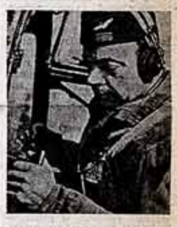
по сделать вывод о том, что Сент-Экзюпери был сбит немецким истребителем.

В 1972 году в одном из номеров западногерманского военного журнала «Ландвер» были опубликованы два документа времен второй мировой войны. Сопоставив их с другими данными позво-