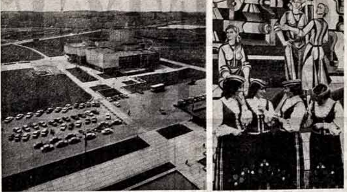
Каждый десятый трудящийся многоэтажного коллектива Антустского заводоуправления Компартии Литвы...