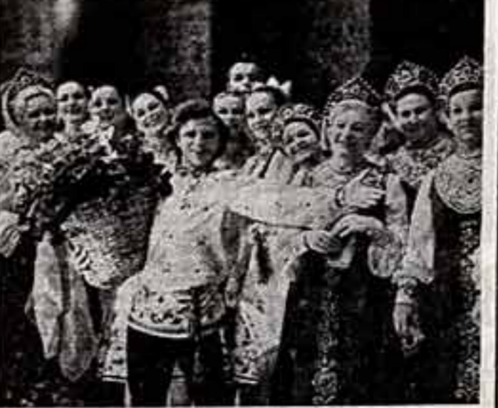
Более 6.000 выступлений на сцене — таков этот работы Государственного Омского русского народного хора за 30 лет.