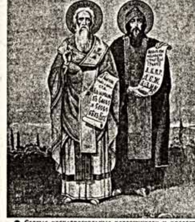
Святые равноапостольные первоучители и просветители славянских земель Кирилл и Мефодий. Икона из храма Рождества Христова в г. Хабаровске.