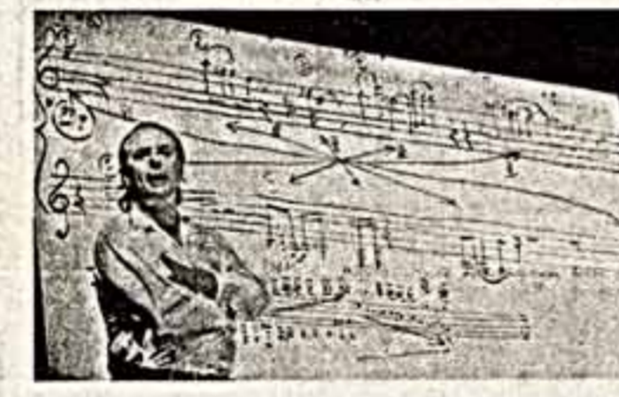
Карлайл Штокхаузен.

Всемирно известный композитор Карлайл Штокхаузен, которого в детстве называли «enfant terrible» — «ужасное дитя», оставается таковым до сих пор.