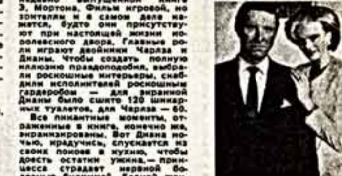
Также кредитуют перед зрителями принца Чарльза и его жену.

В Англии снова переименовывают все парламент иудейского британского короля.