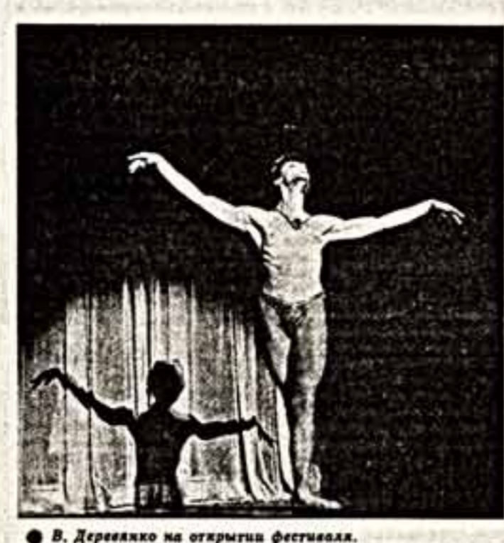
В. Деревянко на открытии фестиваля.

утверждает известный танцовщик Владимир ДЕРЕВЯНКО