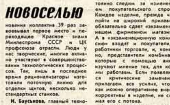
Задания первого года десятой пятилетки коллектив выполнил досрочно. Сверх плана реализован продукция более чем на 1 миллион рублей.