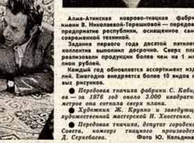
Алла-Атинская коврово-тканая фабрика имени В. И. Ленина-Терешковой — передовое предприятие республики, оснащенное самой современной техникой.