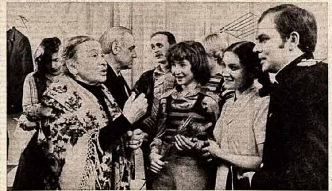
Давняя творческая дружба связывает коллектив завода «Красный пролетарий» и МХАТа СССР. Шесть лет назад мастерами помогали коллективу завода создать театральную студию, в которой работают рабочие и служащие предприятия.

Председатель Президиума Верховного Совета СССР Н. ПОДГОРНЫЙ, Секретарь Президиума Верховного Совета СССР М. ТЕОФАНОВ, Москва, Кремль, 3 декабря 1976 г.