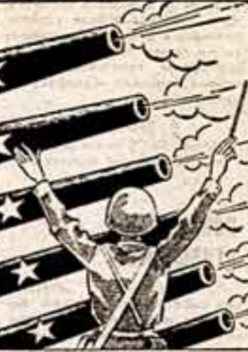
Символы борьбы и труда