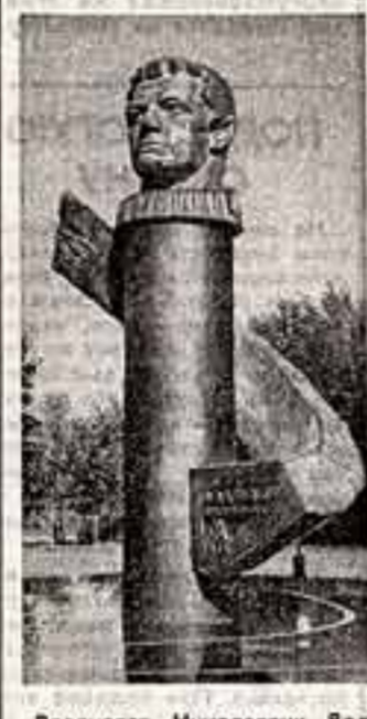
Владислав Николаевич Волков, летчик-космонавт СССР, инженер по профессии, за выдающиеся заслуги в освоении космоса дважды удостоен высокого звания Героя Советского Союза.