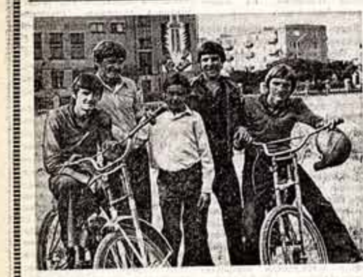
Большую работу проводит спортивно-технический клуб Александрийского городского комитета ДОСААФ Кировоградской области. Активные друзья работает секция мотоспорта, где юнши осваивают фигурное вождение мотоциклов, регулярно участвуют в мотогонках.