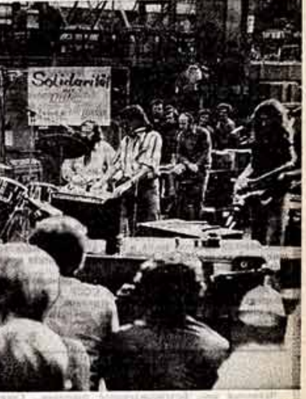
Чувство солидарности с народом Чили, горячее стремление добиться освобождения Луиса Корвалана и других патриотов, толкнул в застенок музыки, объединил всех присутствовавших на этом концерте, который состоялся на столичном театральном заводе.

столуны ГДР. Перед берлинскими рабочими выступила известная музыкальная группа прогрессивной западногерманской молодежи «Фло де Коло» с песнями прогресса и солидарности.