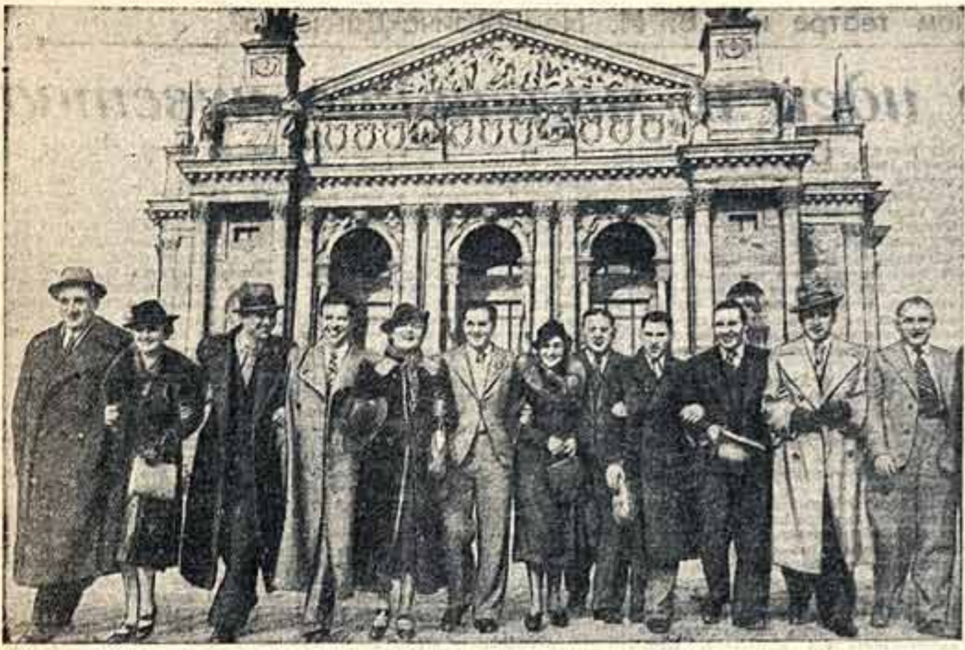
Участники концертной бригады Большого театра СССР...