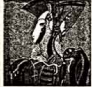
М. Шемакин. Из цикла «Метафизические холмы».