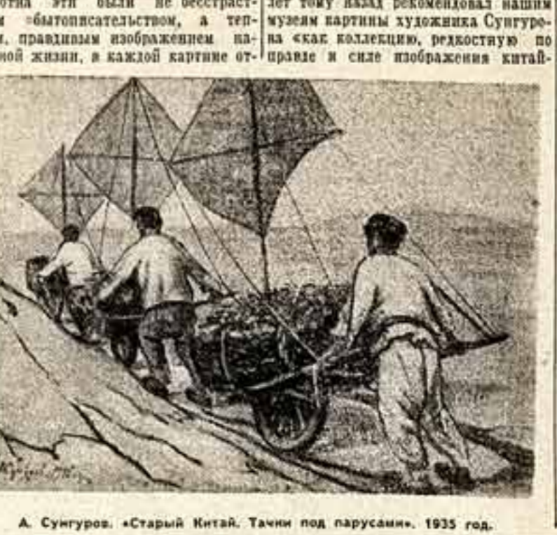
А. Сунгуров. «Старый Китай. Тачи под парусами». 1935 год.

ской городской и деревенской действительности, о которой мы все, кивая, говорим и пишем, но которую изобразить не в силах». И вот мы снова на выставке Сунгурова. На этот раз, кроме китайских картин, экспонированы новые работы художника, посвященные природе Подморовской, Северного Кавказа, Таджикистана. Из трехсот полотен, написанных в Китае, выставлено только шестьдесят. И все же в них богато и восторженно представлены старинный Китай. Посетители по долгу проставляют у таких картин, как «Наводнение», «Взлет рыбачьих палаток», «Старик-крестьянин», «Утомленный рыбак», «Пролок бобов», «Поминные усопших» и др. Теперь совсем по-другому мы смотрим на эти работы художника. Изображенный Сунгуровым старинный Китай неповторимо ушел в небытие. Но чем дальше в историю уходит старинный Китай, тем ценнее становится эти произведения — результат многолетней работы художника-китаеведа. Они помогают нам глубже и ярче ощутить огромное историческое значение великой победы китайского народа, сбросившего двойное иго — империалистического и феодального угнетения и создательного Китайскую Народную Республику — страну строящегося социализма. Тяжело прошлое Китая, правдиво изображенное художником, дает нам возможность отчетливее представить величественное, светлое будущее нашего великого друга — китайского народа-богатыря.