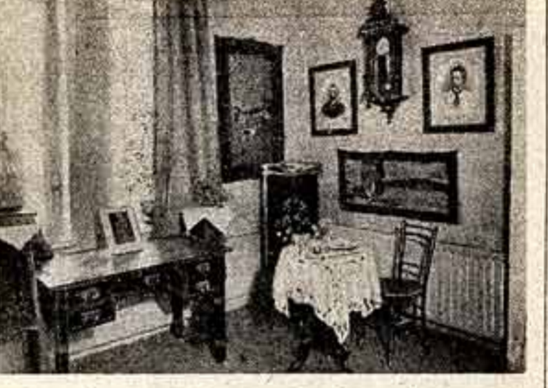
Уголок, воспроизводящий комнату В. И. Ленина в Хельсинки. (Музей Ленина в Тампере).

Гостиный в Москве известный итальянский драматург и театральный деятель Эдуардо Де Филиппо, являющийся с учреждениями искусства столицей, посетил Государственную центральную театральную библиотеку. В связи с его пребыванием в СССР в фонде библиотеки экспонируется выставка на тему: «Искусство Эдуардо Де Филиппо на сцене советских театров». С большим интересом драматург ознакомился с газетными и журнальными рецензиями, посвященными постановкам его пьес, снимками отдельных сцен и афишами, присланными из многих театров страны. Библиотека подарил ему афишу постановки его пьес в разных советских республиках. Э. Де Филиппо поделился своими впечатлениями от первых спектаклей, увиденных в Москве. Поблагодарив сотрудников за выставку и теплый прием, он записал в книге отзыв: «Вы все мои дети: не могу не вернуться сюда». 18 марта в Доме актера состоялась встреча театральной общественности столицы с Эдуардо Де Филиппо. «Читаем «Советской культуре» в добрых пожеланиях и восхищении» ЭДУАРДО ДЕ ФИЛИППО.