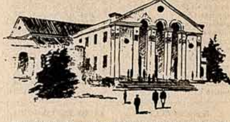
Вот такой клуб воздвигнут в селе Яруга, в колхозе имени Г. И. Петровского.

Ан. ГРЕБНЕВ, спец. корр. «Советской культуры», Винницкая область.