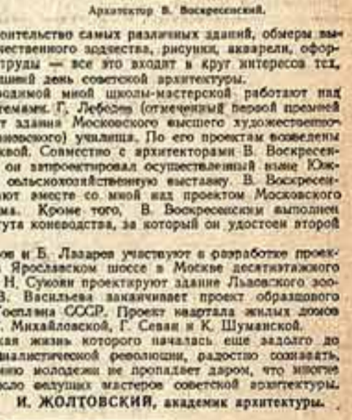
Архитектор И. Жолтовский.