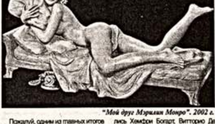
"Мой друг Марилин Монро". 2002 г.

В ГМИИ им. А.С.Пушкина открылась выставка скульптур Джинны Лоллобриджи