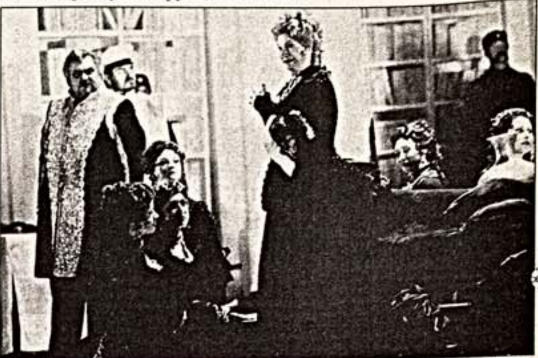
Сцена из спектакля "Чародейки"

В первой картине спектакля сцена (художник — Роберт Иннес-Холл) представляет собой огромный ресторан, который герои оперы, Настасья, более известная под кличкой Кума. Подобный ресторан, заметим, с разным успехом мог бы быть как в Петербурге или Москве, так и в любом европейском городе, но уж менее всего — в Ницце. Но именно здесь происходит действие оперы. Какой-либо определенной национальной идентификации лишены также и костюмы от Татьяны Ногвиной: никаких нам намеков на смену, все больше фразой да венгерские туалеты. Ситуацию усложняет обстановка, которую можно назвать неинтересной, а уж когда начинается русская