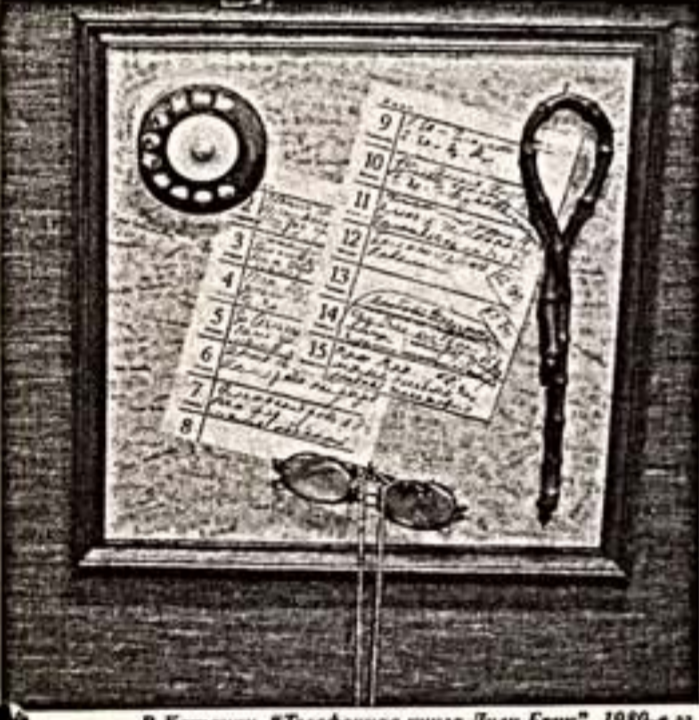
В.Катаков. "Телефонная книга Лили Брик". 1980-е гг.

Из чего делаются шедевры и новые технологии