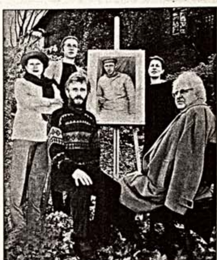
Голицын-художник. 2002 г.

Народный художник России, действительный член Российской академии художеств и член ее президиума Илларион Владимирович ГОЛИЦЫН, которому недавно исполнилось 75 лет, - человек во всех отношениях примечательный. Он потомок древнего княжеского рода, ведущего свое начало с XIV века от великого князя литовского Гедиминаса.