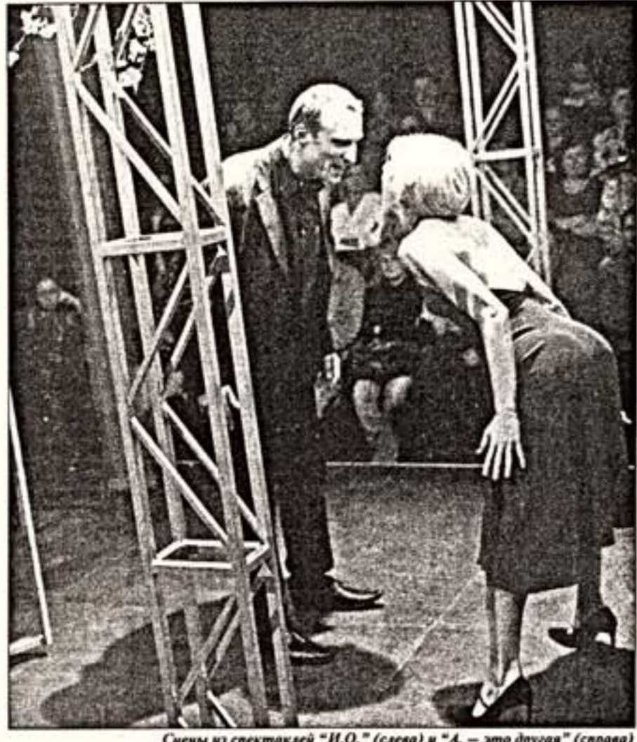
Сцены из спектаклей "Н.О." (слева) и "А - это дружба" (справа)