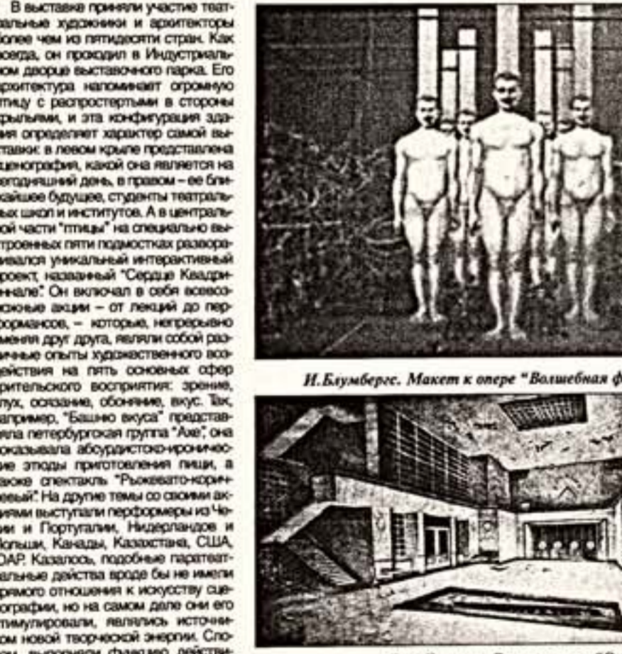
И.Блумберг. Макет к опере "Волшебная флейта" (Латвия)

Всемирный сценографический форум Пражская Квадриеннале