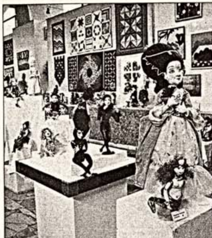
В выставочном зале Московского областного союза художников открылась выставка творческих мастеров...