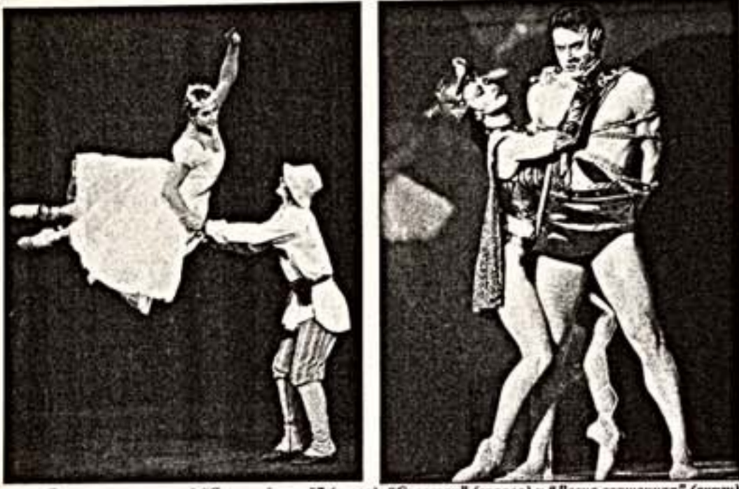
Сцены из спектаклей "Светлый ручей" (слева), "Спартак" (середина) и "Весна священная" (справа)

Московский балетный сезон: ставка на прошлое