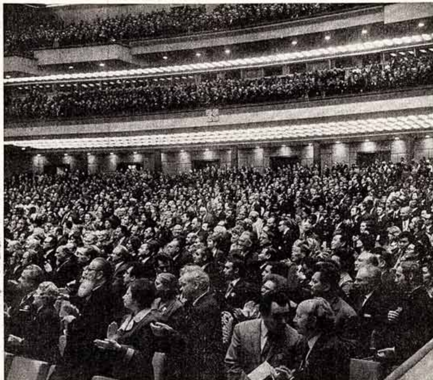
ВЧЕРА В КРЕМЛЕВСКОМ ДВОРЦЕ СЪЕЗДОВ