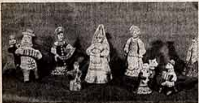
На снимке: гаишские шуршачи из Карговола и Калашина.