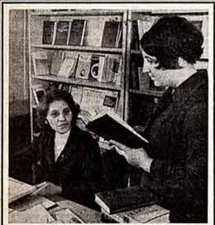
5.500 пропагандистов ведут занятия в системе политического и экономического образования в партийных и комсомольских организациях Коми республики. Большую помощь им оказывают работники Дома политического просвещения областного комитета КПСС.

Советское правительство предпринимает все возможные меры для обеспечения продолжения его активных действий против Арабской Республики Египет и Сирийской Арабской Республики.