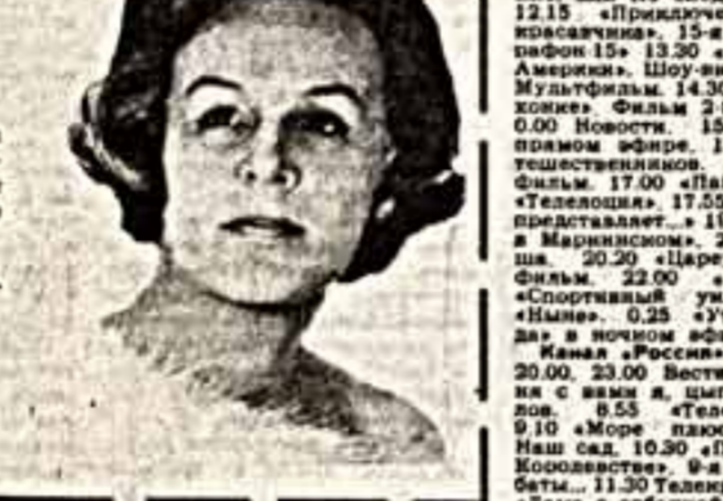
Гелена Великая, Воронеж, 1-4 канал, 23.30.