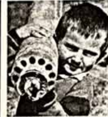
Вот она — наша боль, наше горе и позор. Неужели именовали такие стихи останутся славой яркой памяти о нашей истории!