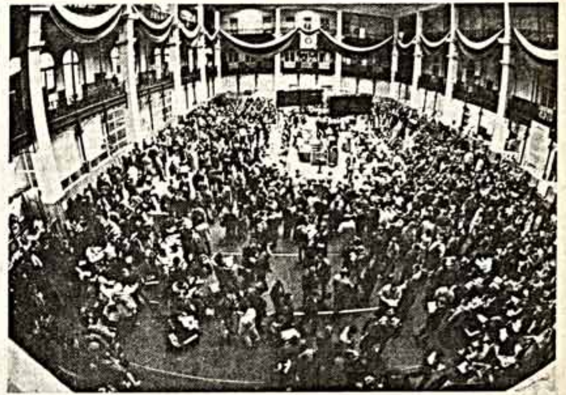
Операционный зал. Идут торги.