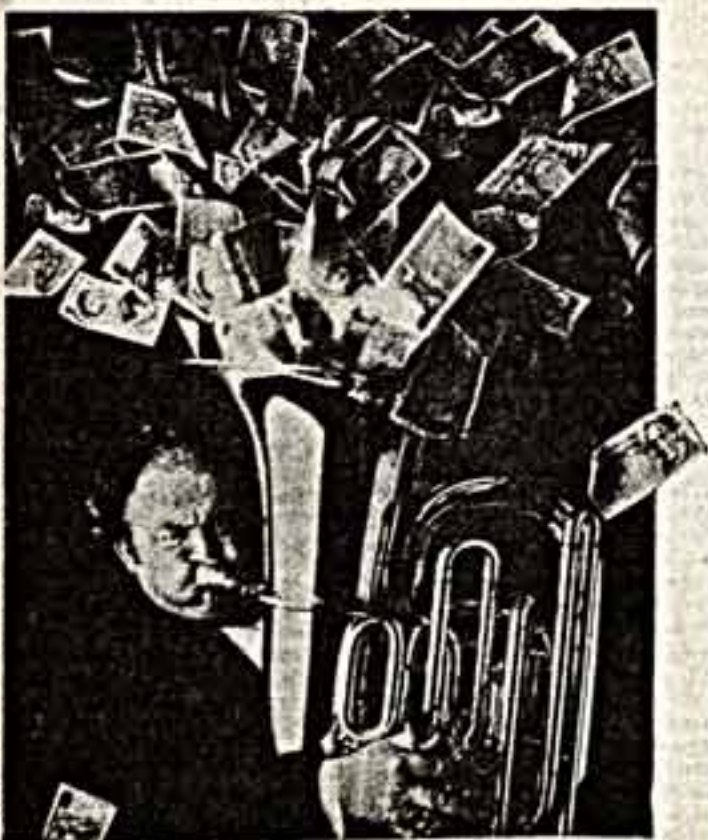
Коллаж из журнала «Экономист» (Англия).