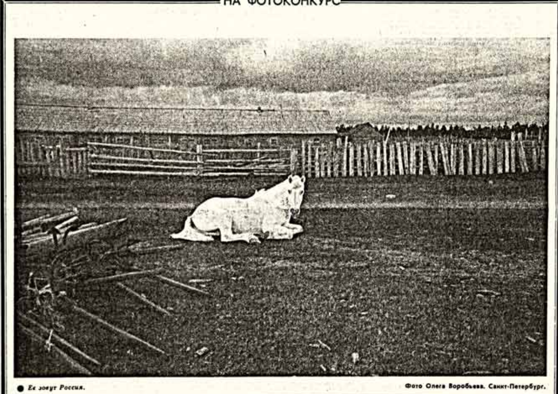
Ее зовет Россия. Санкт-Петербург.