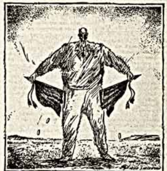
Рисунок Игоря Смирнова.