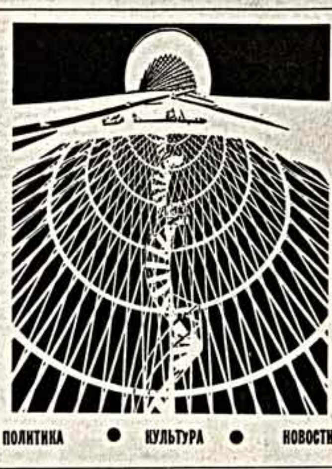
ПОЛИТИКА • КУЛЬТУРА • НОВОСТИ

В конце мая между славянскими «Лантинкалей» будет использо-