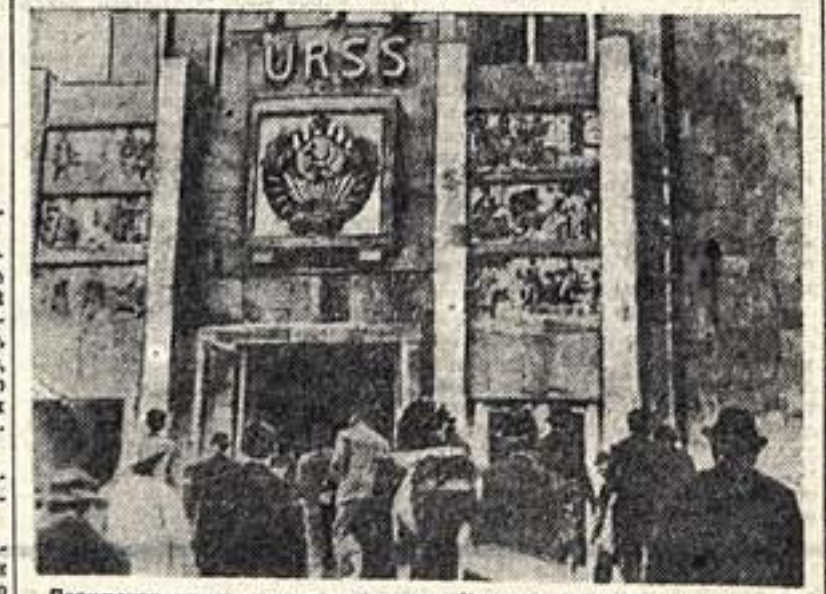
Парижская международная выставка. Центральный вход в Советский павильон.

мало меня до приезда в СССР. Представление в Советском Союзе выставило меня возмущать на вещи по-другому. Я знаю теперь, что главная задача художника — бороться средствами изобразительного искусства за передовые идеи человечества. Из Москвы я отправился в Нормандию, где исполнял роль моего родного города есть угольные шахты, рисунки рабочих, которые там трудятся, я постарался передать через будущих хозяев французского Донбасса. В окрестностях Парижа я думаю побывать на крупнейшей предприятии французской индустрии, чтобы передать типичные черты французской пролетарии. Первое, что я сделал по возвращении на родину, — поступил в Ассоциацию революционных художников и Общество друзей СССР. Годы через два я думаю вернуться снова в СССР — отчетливо всех трудящихся.