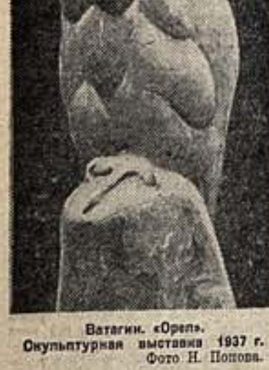
Ватагин. «Орел». Скульптурная выставка 1937 г.