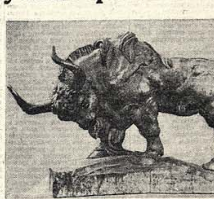
Баландина. «Лобан». Скульптурная выставка 1937 г.

Второй месяц в Государственном музее изобразительных искусств им. Пушкина открыта выставка московских скульпторов, по количеству участников и представленным им работам — самая впечатляющая из всех выставок нашей скульптуры. На выставке собраны работы московских скульпторов за последние два года. Представлены многообразные сюжеты и жанры, различные творческие устремления, различные возрасты и дарования. Выставка не является «парадом достижений» нашей скульптуры. Это всего лишь очерковая обзорная выставка. Рост нашей скульптуры за последние годы выразился в первую очередь в произведениях, исполненных для Парисской выставки, для канала Волга-Москва и, наконец, для отдельных выставок «Индустрия социализма» и «Двадцатилетия РККА». Неудивительно поэтому, что выставка в Музее им. Пушкина демонстрирует преимущественно великие, создаваемые скульпторами произведения с основными работами: здесь преобладают интимные портреты, этюды с натуры, эскизы монументальных фигур, изображения животных, образцы монументальной скульптуры большой и малой форм. Совершенно очевидно, что, когда бы ни была оценка выставки в целом, ее участники — советские художники — имеют право претендовать на серьезную, внимательную и всестороннюю критику.