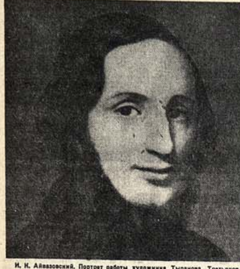
И. К. Айвазовский. Портрет работы художника Тырнова. Третьяковская галерея.