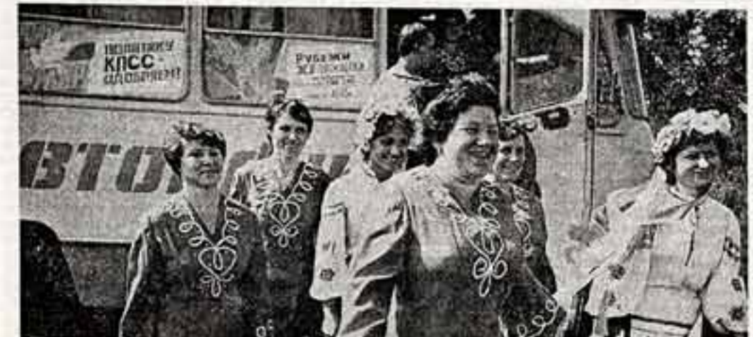
Для участников агитбригады уборочная страда — тоже напряженное время. Из бригады в бригаду переходят они, чтобы в короткие дни...

Нарядные, в приподнятом настроении пришли первые посетители в новый Симанский дом культуры. Здесь уже начались репетиции коллективных самодеятельных, готовятся вечера молодежи, демонстрируются кинофильмы.