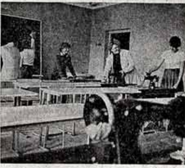
Впервые переступит порог новой школы-интерната на 300 мест учащиеся Зеленограда. Ее светлый корпус раскинулся в одном из живописных уголков города — спутника Москвы. Просторные классы, швейная и столярная мастерские с современными оборудованными, актовый и спортивный залы — все это будет способствовать учебе, труду и отдыху ребят.