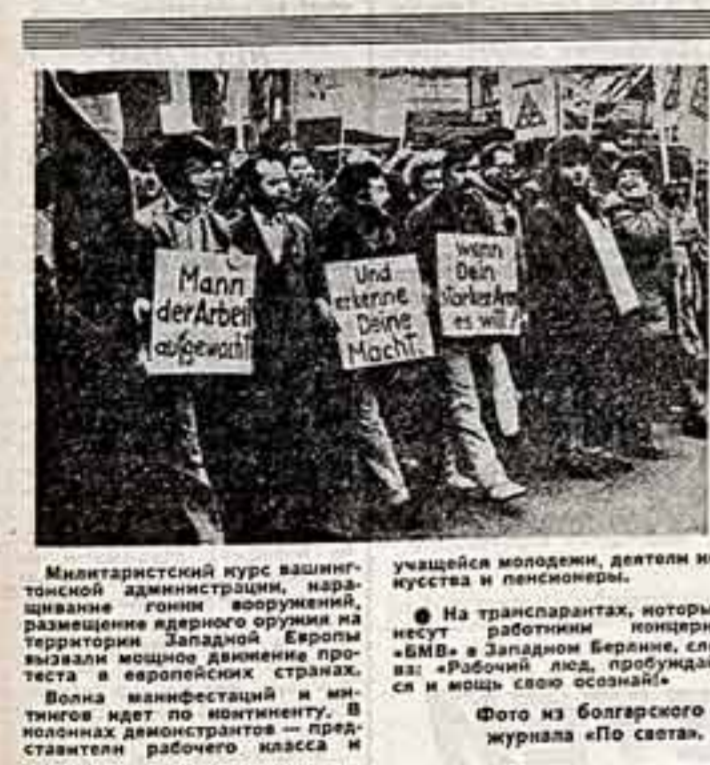
Милитаристский курс администрации, наращивание гоним мирнолюбивой политики Западной Европы вызвали мощное движение протеста в европейских странах.