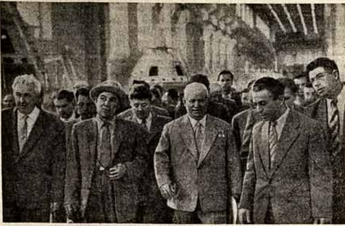
Торжественное открытие Волжской гидроэлектростанции имени В. И. Ленина. На снимке: руководители Коммунистической партии и Советского правительства в машинном зале гидроэлектростанции.

1958 год 12 АВГУСТА ВТОРНИК № 96 (810) Цена 40 коп.