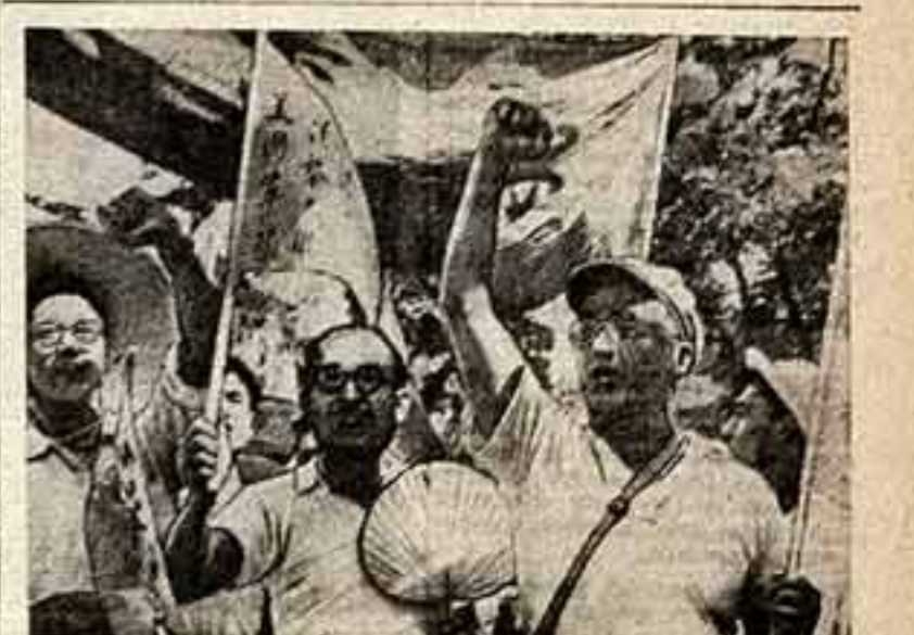
Пезини, 600-миллионный китайский народ гневно осуждает американскую интервенцию в Ливане и Иордании. На сцене группа преподавателей вузов Пезини во время демонстрации протеста.

Болгарская кинематография находится в таком положении, немалый производственный и творческий опыт, подготовила кадры специалистов — способных режиссеров, сценаристов, операторов, звукооператоров, инженерно-технических работников.