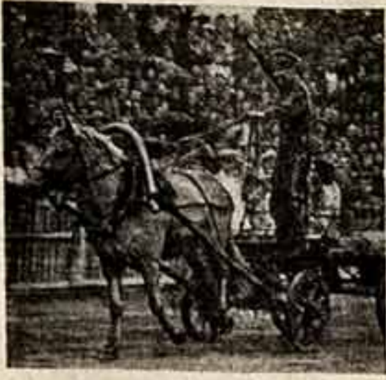
Григорий Мелехов и Аннина проносятся по стадиону на танчане (артисты П. Глебов и Э. Быст. Фидель).