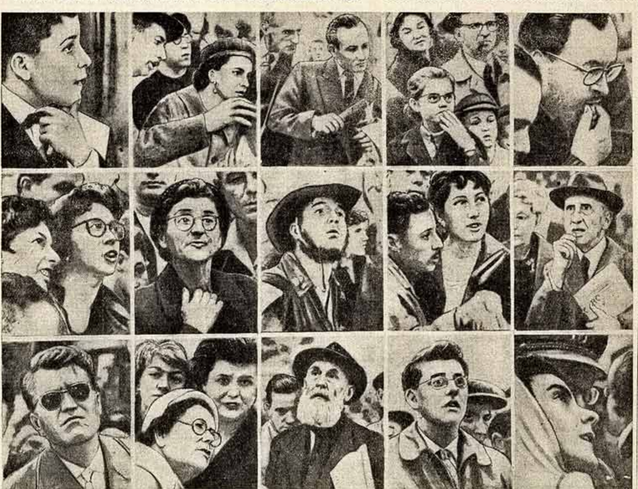
Перед макетами искусственных спутников Земли. Репортаж немецкого фотографа Хорста Е. Шульца из Советского павильона на Всемирной выставке в Брюсселе. (Из детской газеты «Лидс оф фолькс».)

«Советская культура» выходит по четвергам и субботам. АДРЕС РЕДАКЦИИ И ИЗДАТЕЛЬСТВА: Москва, Б-64. Частные письма, 18/8. Телефонные секретариаты редакции К 7-30-26; отдел информации К 7-30-07 и К 7-40-71; отдел театра, И 7-07-64; отдел музеев и эстрады К 7-18-63; отдел изобразительного искусства К 7-09-43; отдел кино И 7-14-71; отдел музыкального строительства К 7-20-00; отдел пропаганды и науки К 7-10-10; отдел литературы, полиграфии и издательского дела К 7-11-44; отдел профессиональной жизни К 7-11-44; отдел оформления К 7-09-05; издательство К 7-20-10, буллетень К 7-07-52. Телефоны: редакция К 7-30-26; отдел информации К 7-30-07 и К 7-40-71; отдел театра, И 7-07-64; отдел музеев и эстрады К 7-18-63; отдел изобразительного искусства К 7-09-43; отдел кино И 7-14-71; отдел музыкального строительства К 7-20-00; отдел пропаганды и науки К 7-10-10; отдел литературы, полиграфии и издательского дела К 7-11-44; отдел профессиональной жизни К 7-11-44; отдел оформления К 7-09-05; издательство К 7-20-10, буллетень К 7-07-52. Типография газеты «Гудок», Москва, ул. Станкевича, 7. Зак. № 2553.