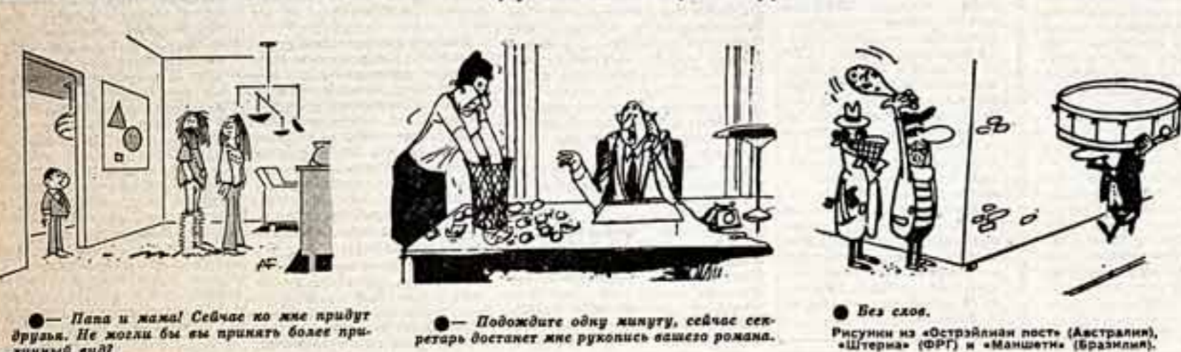
— Папа и мама! Сейчас ко мне придет дружок. Не могли бы вы принять более приятный вид?

В 1.30 ночи 9 апреля к пляжу Доув подошли шесть резиновых катеров с выключенными моторами. Их движение направляли с близка сигнальная дыра — мужчина и женщина. Помощники, практически со всеми значительными фигурами, появившимися в политической или военной разведке со времени основания государства Израиль».