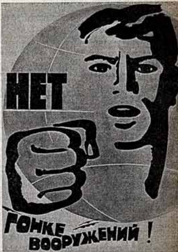
Изображение «Павлов», художник Р. Сурьяшинов.

В наши дни все те, кто поощряет своими действиями гонимую вооружений, дальнейшее накопление в мире средств массового уничтожения людей, ратуют за применение силы при решении спорных вопросов между государствами или просто закрывают глаза на опасность, подстерегающие сегодня мир, фактически подталкивают человечество к бездне.