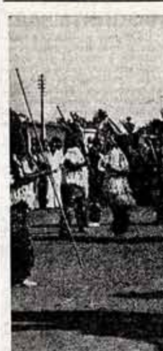
В столице Камеруны Яунде.