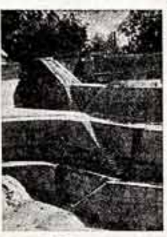
НДРГ. Исторические водоёмы в старом районе Адена — Кратер. Археологи относят их строительству к I столетию н. э. Общий объём всех 18 водоёмов, расположенных в середине прошлого века, — 30 миллионов литров воды. Они были вырыты в период скачка и слухов о приближении для снабжения города питьевой водой, скапливающейся здесь в результате горных водных потоков.

На диск исполнилось сорок лет замечательному американскому поэту, певцу и композитору, автору многочисленных песен протеста Бобу Дилану. Рассказывая, пожалуй, о его творчестве, о том, что это за человек.