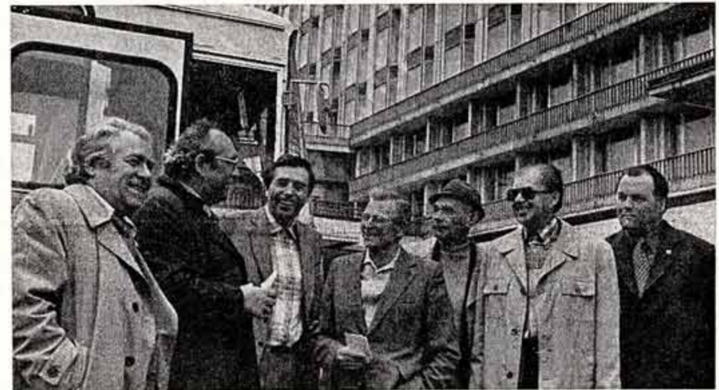
Группа делегатов IV съезда кинематографистов СССР в гостинице «Россия».