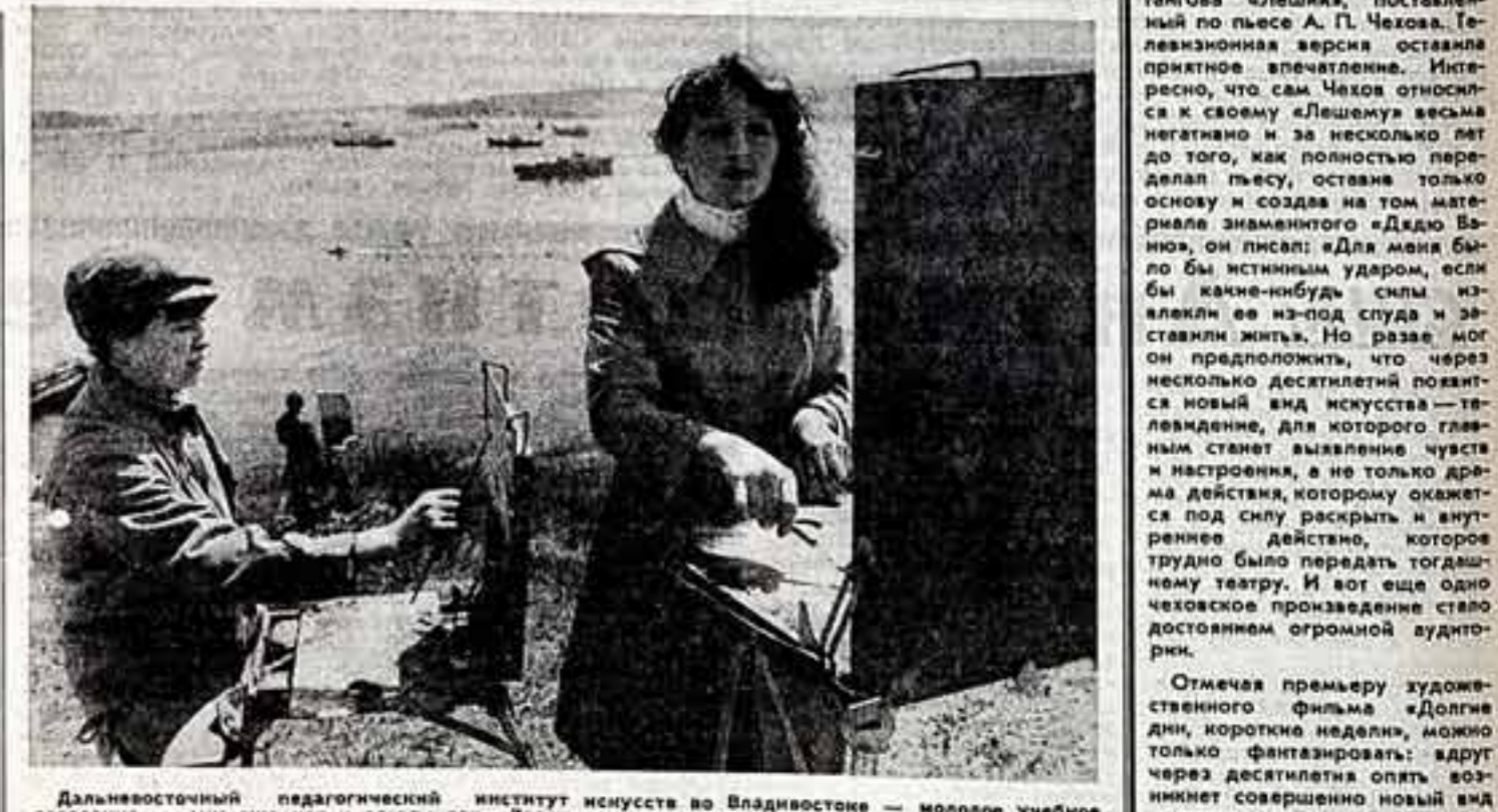
Дальневосточный педагогический институт искусств во Владивостоке — молодое учебное заведение — ему уже лет и десять лет. Здесь готовят преподавателей музыки, оркестрантов, актеров драматических театров, артистов музыкальных школ, многолетних. Всего на дневном и заочном отделениях здесь участвует около 800 человек. Ю. ПОЛОГОНКИН.