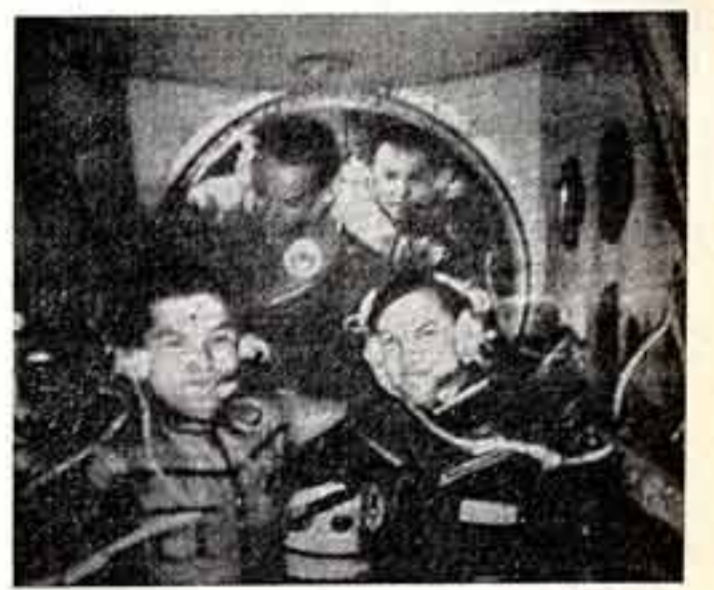
Слева направо — космонавты В. Коваленко, Л. Попов, В. Савиных и Д. Прунзариу на борту научно-исследовательского комплекса. (Снимок получен по телекоммуникационной связи).

Масштабный разговор о проблемах киноискусства, который пойдет на нашем профессиональном форуме, безусловно, коснется и вопросов актерского мастерства, подготовки молодой артистической смены. Меня это особенно интересует и волнует, поскольку работа съезда пойдет на уровне высоких требований времени. Советская школа актерского мастерства давно снискала мировую славу, но есть сегодня немало творческих, организационных и, я бы сказал, нравственных проблем, которые требуют серьезного осмысления и обсуждения. Одной из главных задач представляется мне повышение ответственности актеров перед зрителем за свой труд, за идейно-художественное совершенство создаваемых образов.