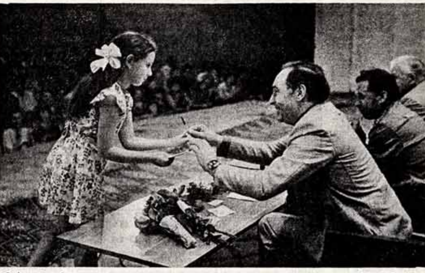
Автограф любимого актера.

Молодые — это наше будущее, а каждому хочется, чтобы будущее было лучше настоящего. Мне хотелось бы, чтобы молодые сверстники режиссера-постановщика и актера, принимаясь за создание новых фильмов, помнили о великой воспитательной силе кино, о его огромном вкладе в развитие культуры, сознательному отношению и социальному долгу, умению любить преданно и бескорыстно. А ведь у нас порой в фильмах грусть выдвигается за признак современности. Но разве таким должен быть наш современник и разве он такой? Н. КИСЕЛЕВА, ДЗЕРЖИНСК, Горьковская область.