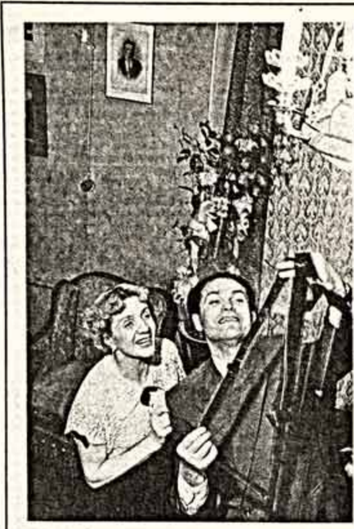
В прошлом году мы калечатся выбором снимков. Единичные кадры фотографа Николаевича Халипова...