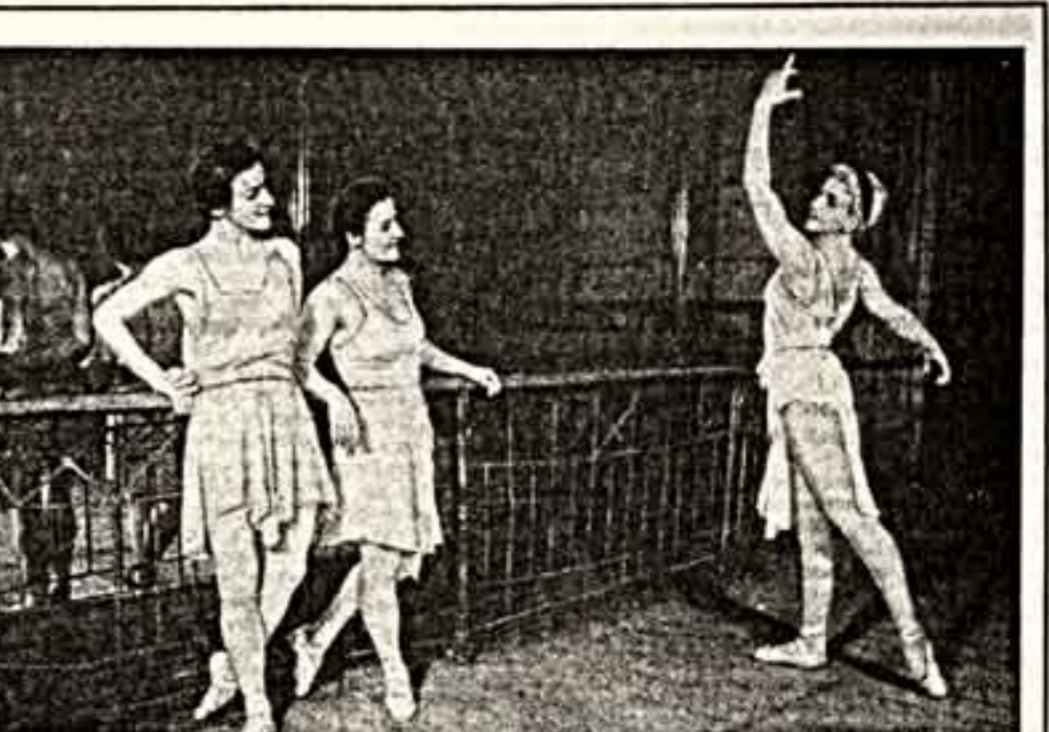
МГНОВЕНИЯ, ОСТАНОВЛЕННЫЕ ЯКОВОМ ХАЛИПОМ