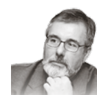
Автор — обозреватель «Культуры»

Нравственное помрачение запретам и публичным осуждением, увы, не исправит. Сегодня мы сполна пожинаем плоды того, что два десятка лет намеренно сеяли у нас в образовании специальные люди. Очевидно, что перед министром Васильевой стоит тяжелейшая системная задача: не только вычистить сад от накопившейся гнили, убрать негодных садовников, но и вернуться к забытому посеву «разумного, доброго, вечного».