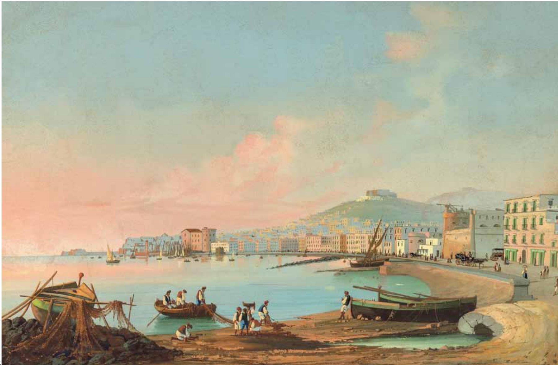
Д. ПАТРИА «ВЕАТОПЛИНСКИЙ ЗАЛИВ»