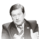
Автор — сопредседатель движения «Народный Собор»

гражданами «недружественных» стран, на приобретение там собственности и на уже имеющуюся недвижимость. Хватит кормить братушек — пора и о себе подумать. Данная мера наверняка приведет к сокращению туристического потока в страну Монтенегро, а ведь именно содержимое кошелеков наших желающих окунуться в средиземноморские воды соотечественников и формирует в значительной степени бюджет этого бывшего югославского государства. И тогда будьте уверены: двух месяцев не пройдет с начала курортного сезона, как любовь к России и россиянам у оказавшихся на пороге безденежья черногорцев всплывет просто с невероятной силой. А мы еще подумаем: прощать блудных братушек или нет.