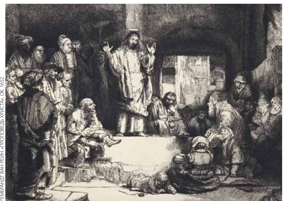
РЕМБРАНДТ ВАН РЕЙН «ПРОТОВЕЛЬ УРАСТА», ОК. 1632

Под многими полотнами скромно написано: «Экспонируется