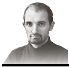
Автор — публицист

После возникновения «крымского консенсуса» вокруг фигуры Владимира Путина даже сама возможность противостояния между Думой и Кремлем видится невероятной, и нужно использовать ближайшее десятилетие для создания в России полноценной законодательной власти. Которая, конечно, станет такой лишь в том случае, если сами депутаты начнут представлять интересы народа, и ничьи больше. Тогда у нас будет сильный парламент, что вместе с сильным президентом сделает Россию устойчивее и мощнее.