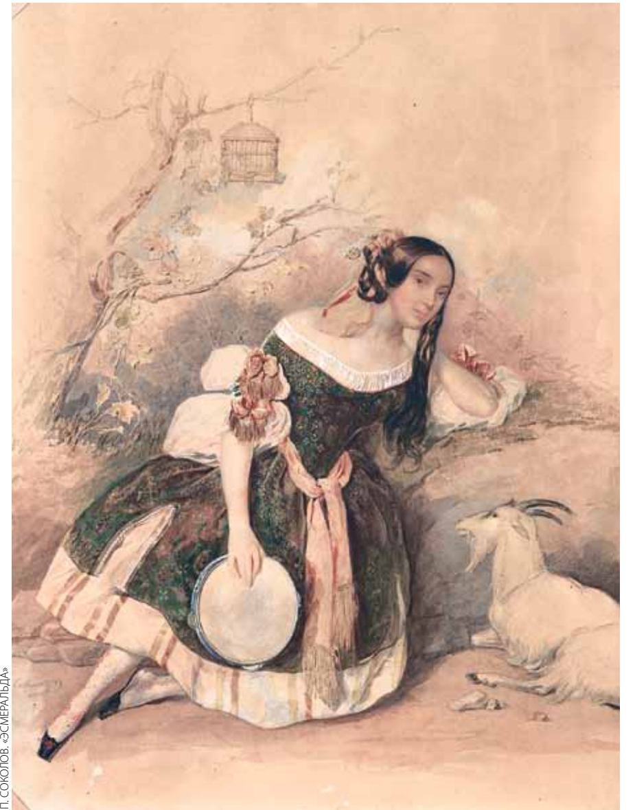
П. СОНОВЕВ «ЭСМЕРЛЬДА»