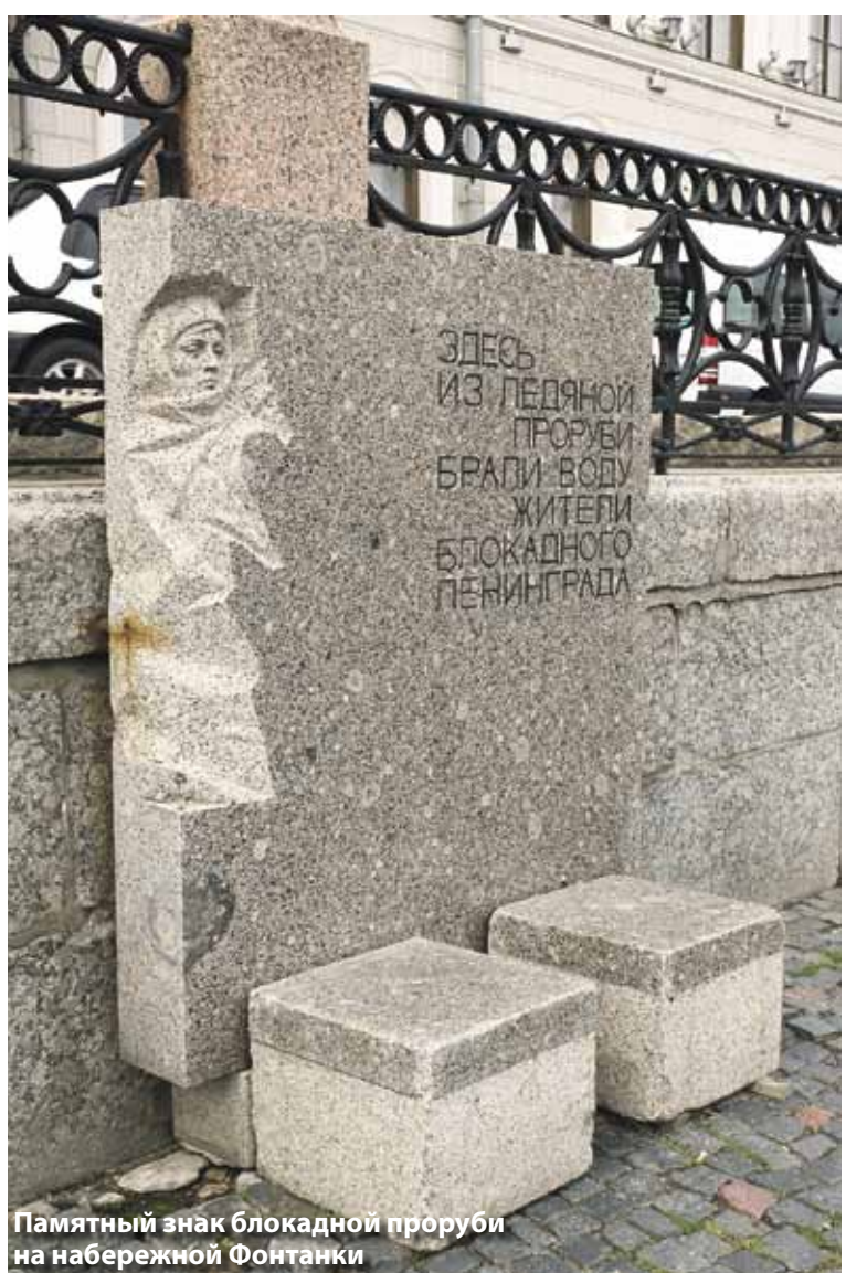
Памятный знак блокадной проруби на набережной Фонтанки

Какое-то время вопрос о мемориале обсуждался в кулуарах, но