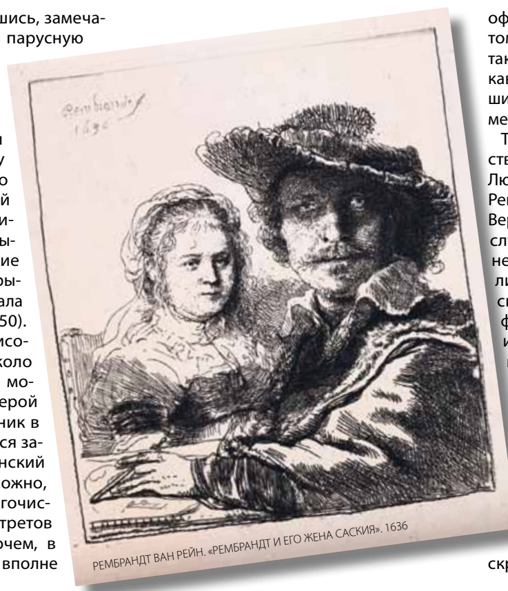
РЕМБРАНДТ ВАН РЕЙН «РЕМБРАНДТ И ЕГО ЖЕНА САСКИЯ», 1636

летия. Приглядевшись, заметишь крошечную парусную лодку («Хижина у канала», 1645). Или разлапистые мельницы — таким мастер увидел современный ему Амстердам (около 1640), не похожий на нынешний туристический центр. Выразительны людские фигурки: скажем, рыбак, сидящий у канала с лебедями (1650). В «Пейзаже с рисовальщиком» (около 1645) отражен момент рефлексии: герой эстампа — художник в шляпе, пытающийся запечатлеть деревенский дом. Вполне возможно, это один из многочисленных автопортретов Рембрандта. Впрочем, в экспозиции есть и вполне