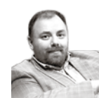
Автор — публицист

Не так давно Дмитрий Быков в очередном опусе заявил, что «поклонение Достоевскому нас привело к Мотороле». И я не готов с ним спорить. Мысль о невинности слезинки ребенка, помноженная на глупоту цивилизованного Запада, приводит нас к пониманию святой истины: единственная гуманитарная организация, которую интересуют русские, — это батальон «Спарта», единственный омбудсмен для расстреливаемого Донбасса — Моторола. Если мы одетой в броневую перчатку рукой не сотрем с детских щек слезу, этого больше не сделает никто.