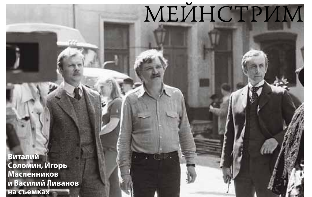
Виталий Соломин, Игорь Масленников и Василий Ливанов на съемках