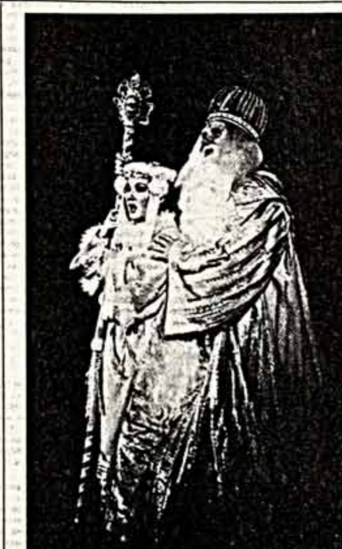
Свой 49-й сезон Татарский государственный театр оперы и балета имени М. Джалиля открыл премьерой оперы М. А. Римского-Корсакова «Снегурочка».