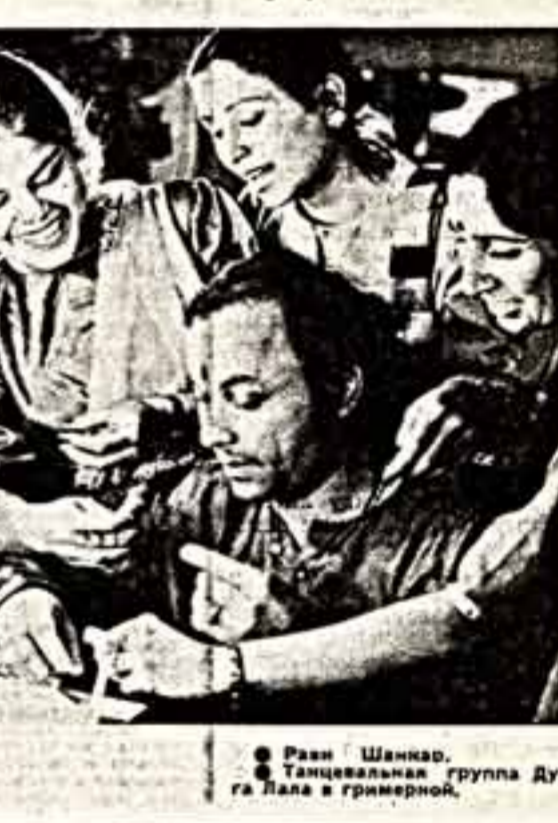
Рави Шанкар. Танцевальная группа Дурга Лала...