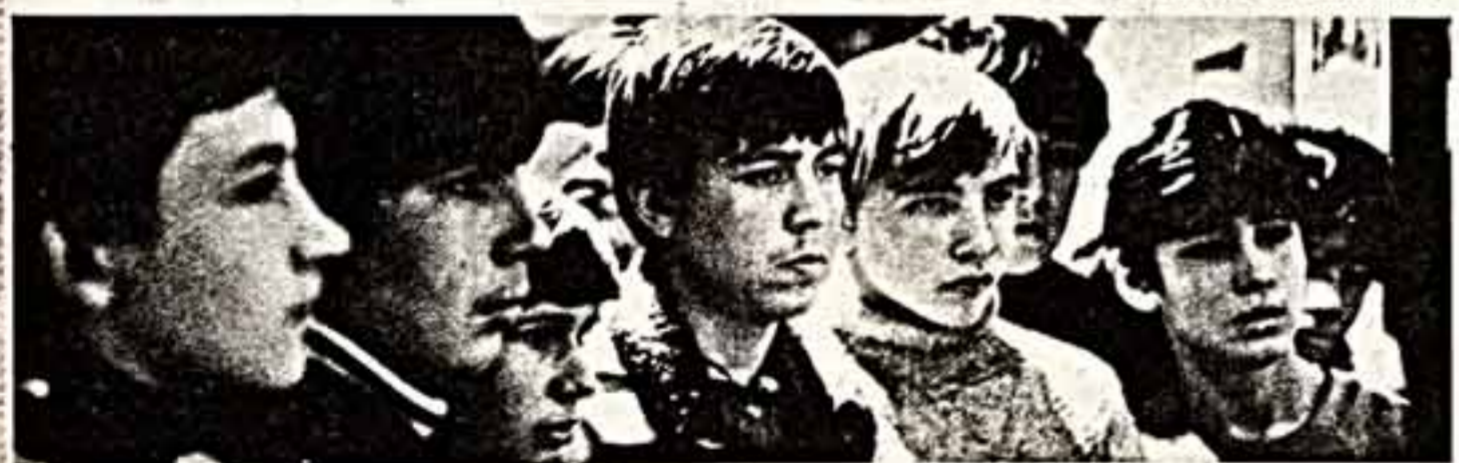
В ПРЕНИЯХ 5-7 МИНУТ