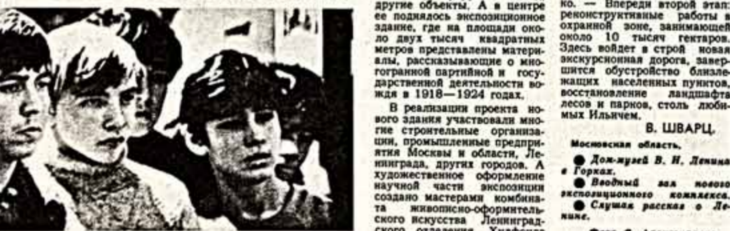
Московская область. Дом-музей В. И. Ленина в Горках.