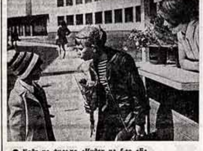
Кадр из фильма «Чуха из 5-го «Б»»