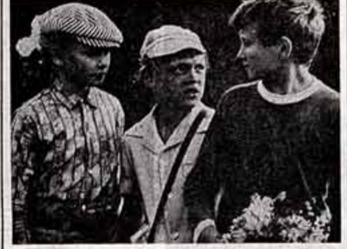
Кадр из фильма «Зимородок»