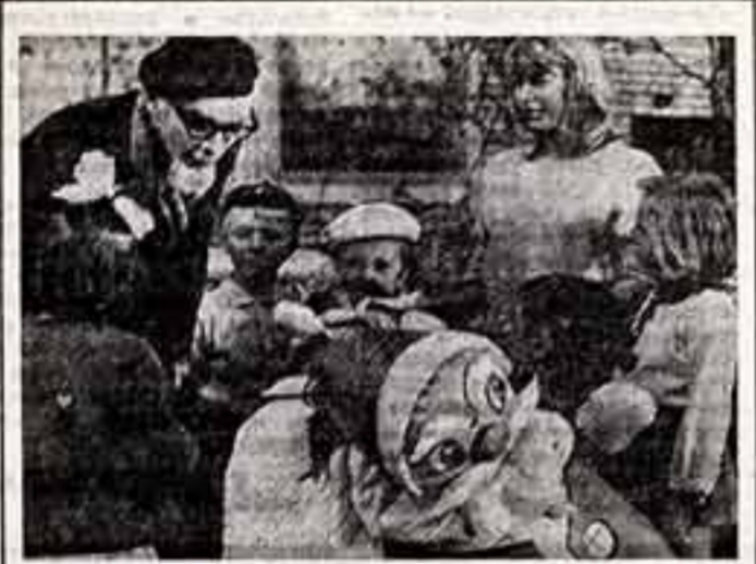
Кадр из фильма «Внимание, черепахи!»

Вот есть, как я уже писал выше, и такие мастера, которые все свое творчество посвящают растущему человеку, стоящему на рубеже большой, взрослой жизни, или тому, который еще только-только по-