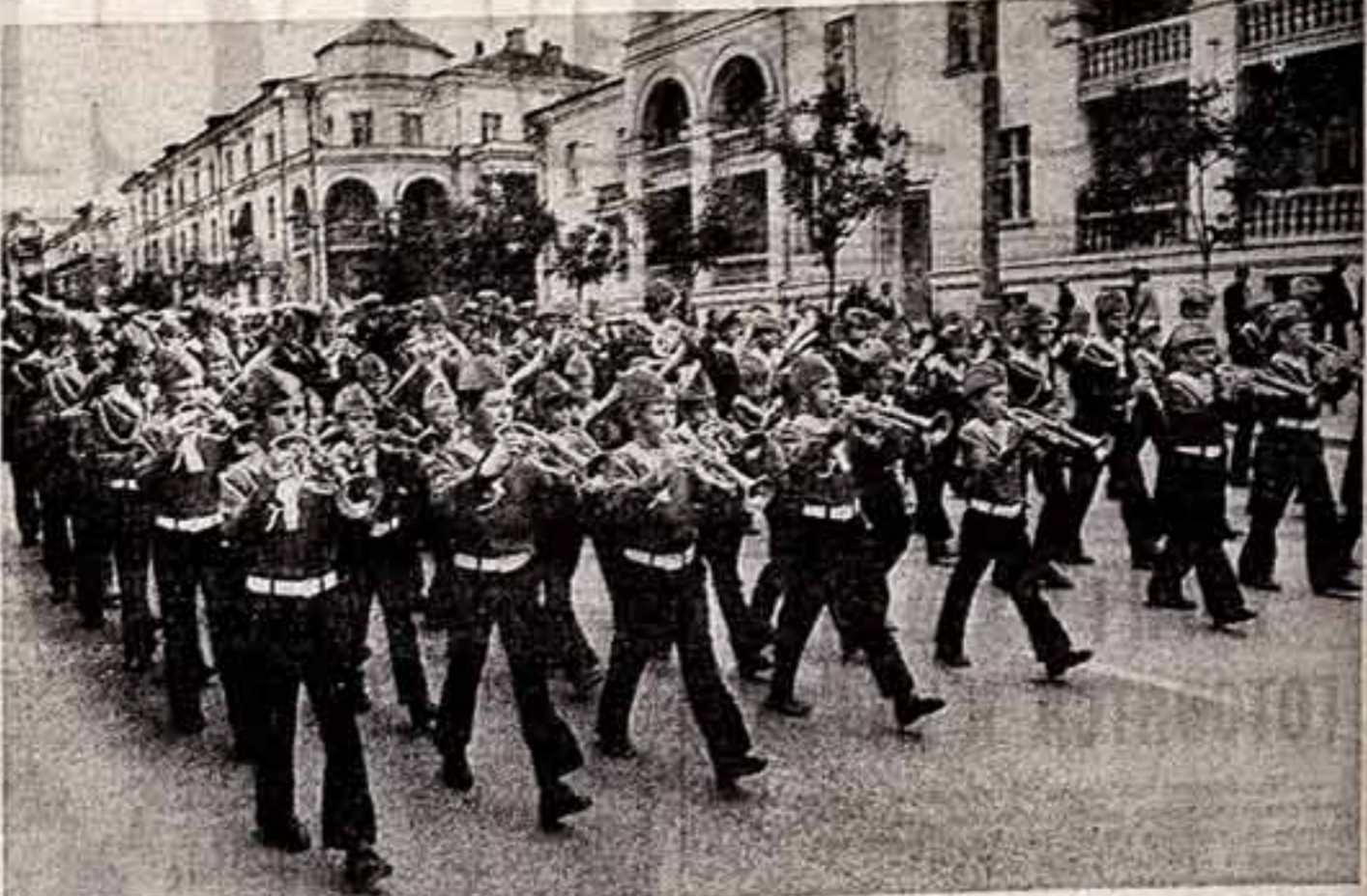
Севастопольский сольный духовой оркестр на проспекте Нахимова.