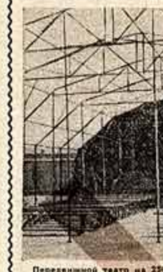
Передвижной театр на 250—300 мест.

нат Львовского областного управления культуры. Есть в нем хорошая библиотека, плакаты и стенды наглядной агитации, проигрыватель с набором грамзаписей и радиотрансляционный узел, а также все необходимое для демонстрации кинофильмов, включая свою «электростанцию».