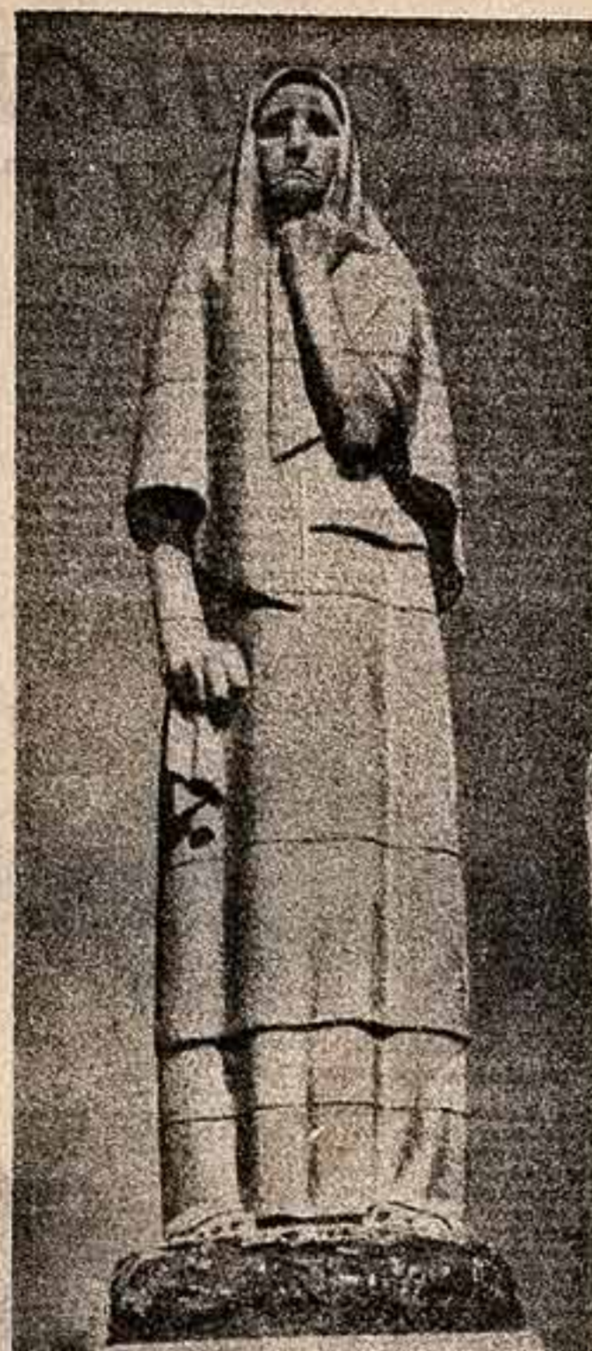
Г. Нойубовиц. Памятник жертвам фашизма в деревне Пирюпос Кировской ССР. Присуждена серебряная медаль Академии художеств СССР.

«СОВЕТСКАЯ КУЛЬТУРА» 2 стр. 1 июля 1961 г.