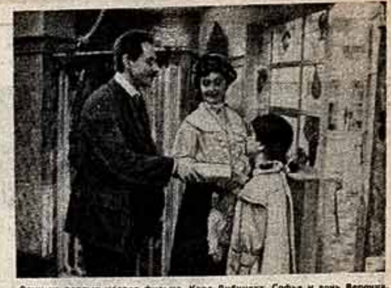
Один из первых кадров фильма. Карл Либкнехт, Софья и дочь Вероника.