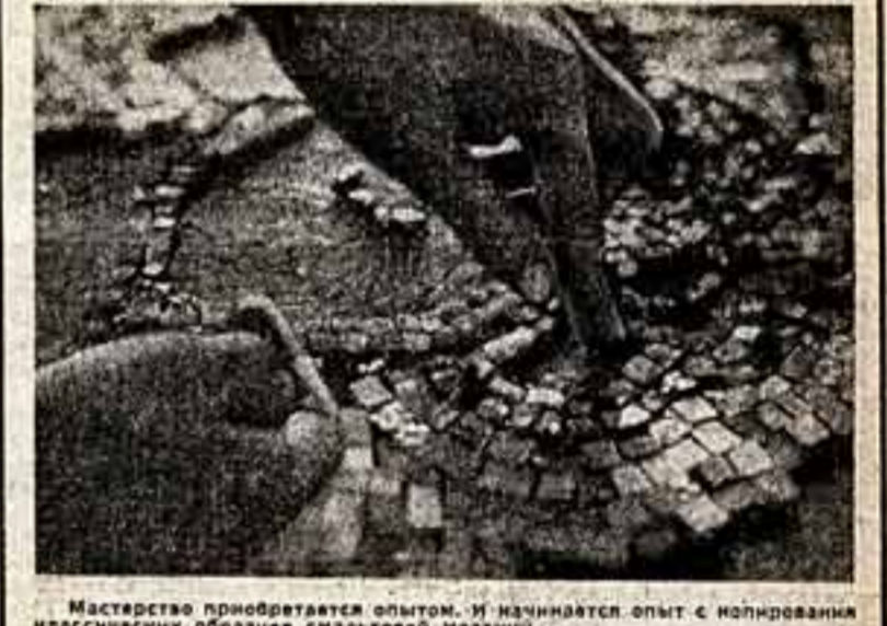
Мастерство приобретает опыт, и начинается опыт с копирования классических образцов.

ЦЕЛЫЙ процесс обучения, сейчас идут приемы знания... Сто сорок лет исполнилось Московскому высшему художественно-промышленному училищу, которое по праву можно назвать «Строгановкой». Сто сорок лет, а Строгановка не стареет. В наши дни задачи училища особенно ответственны. Его воспитанники должны сыграть большую роль в создании новых моделей машин, станков, приборов, мебели, прекрасных форм в интерьере, в современной скульптуре, в керамике. Уже в стенах училища они создают различные ценности — то, что нужно строительству, промышленности, быту. Среди выпускников и дипломных работ можно встретить проекты интерьеров для гостиниц, университетской сельскохозяйственной машины, монорельсовой дороги, чайной сервиза. Студенты помогают реконструировать цехи заводов и создают проекты и модели новых изделий.