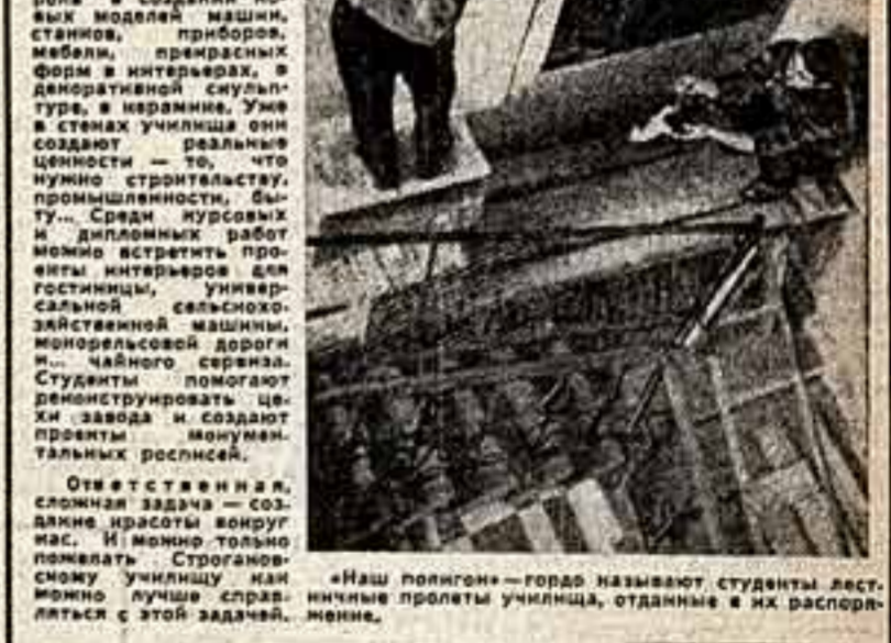
«Наш полигон» — гордо называют студенты летательные прототипы училища, отданные в их распоряжение.

ЦЕЛЫЙ процесс обучения, сейчас идут приемы знания... Сто сорок лет исполнилось Московскому высшему художественно-промышленному училищу, которое по праву можно назвать «Строгановкой». Сто сорок лет, а Строгановка не стареет. В наши дни задачи училища особенно ответственны. Его воспитанники должны сыграть большую роль в создании новых моделей машин, станков, приборов, мебели, прекрасных форм в интерьере, в современной скульптуре, в керамике. Уже в стенах училища они создают различные ценности — то, что нужно строительству, промышленности, быту. Среди выпускников и дипломных работ можно встретить проекты интерьеров для гостиниц, университетской сельскохозяйственной машины, монорельсовой дороги, чайной сервиза. Студенты помогают реконструировать цехи заводов и создают проекты и модели новых изделий.