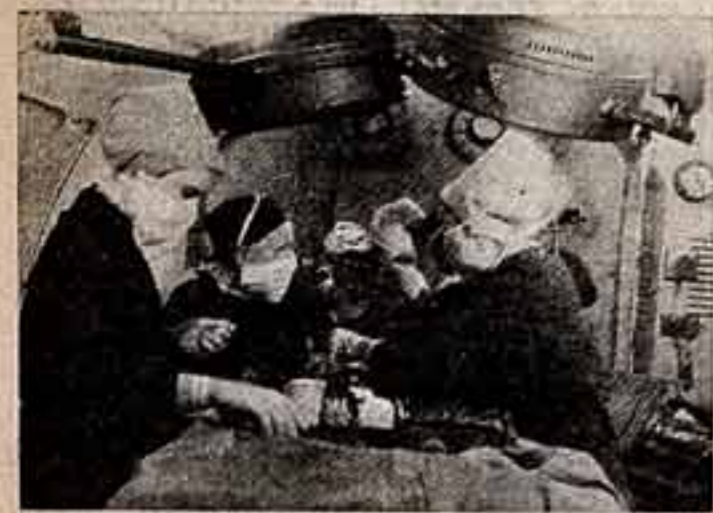
19 ИЮНЯ — ДЕНЬ МЕДИЦИНСКИХ РАБОТНИКОВ

Прошло два года после открытия центра реабилитации Весоюзного научно-исследовательского института физической и экспериментальной хирургии Министерства здравоохранения СССР. За этот период проведено более 20.000 сеансов лечения под повязочным давлением, выполнено около 100 операций.