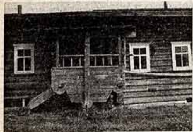
Вскоре с памятниками национального зодчества можно будет познакомиться в архитектурно-краеведческом музее...