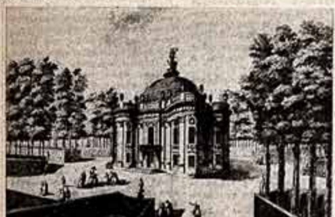
Самая длинная аллея парка завершилась зданием Бельведера...