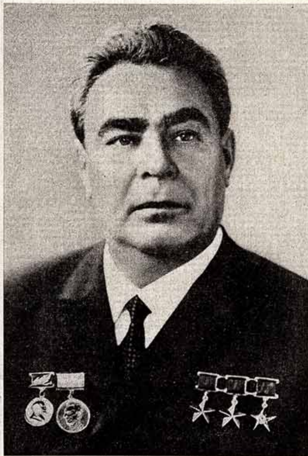
Генеральный секретарь ЦК КПСС, Председатель Президиума Верховного Совета СССР товарищ Леонид Ильич БРЕЖНЕВ.