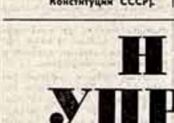
«Граждане СССР имеют право на пользование достижениями культуры».

В этом году все усилия советских людей направлены к тому, чтобы новыми трудовыми успехами встретить 60-летие Великого Октября. Символично, что Основной Закон нашей жизни будет утвержден в этом юбилейном году. Испытав чувство гордости за нашу великую Родину, читая проект Конституции и доклад Л. И. Брежнева на майском Пленуме ЦК КПСС. Как любитель художественной самодеятельности и народного творчества, хочу высказать свое мнение о статье Конституции, где говорится о развитии искусства и народного художественного творчества. Мне кажется, что необходимо внести такое дополнение в статью 27 Конституции: «Заботу о развитии народного художественного творчества проявляют предприятия и организации, а чья распоряжения находятся дома культуры, клубы. Предприятия и организации отвечают за деятельность коллективов народного творчества, наравне с выполнением хозяйственного плана». Такое дополнение заставит многие организации по-новому относиться к нашей сокровищнице — народному творчеству, даст новый стимул дальнейшему развитию народного искусства.