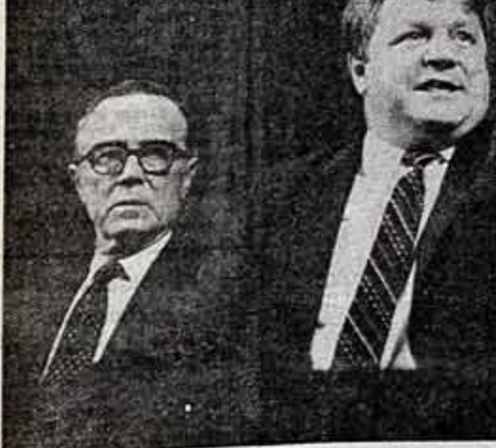
В главных ролях народный артист СССР Юрий Мажуа, народные артисты СССР Анатолий Рещеткин, Александр Ануров, Алексей Сидяков. ● Сцена из спектакля «Каштанов» — А. Ануров, Шахматов — Ю. Мажуа.

На выездном секретариате в Баку, в частности, говорилось и о роли критики, киноведения в формировании высокой культуры восприятия у зрителей — это полностью соответствует требованиям посланного кино постановлению ЦК КПСС и Совета Министров СССР: «...обеспечить дальнейшее развитие киноискусства и киноведения».