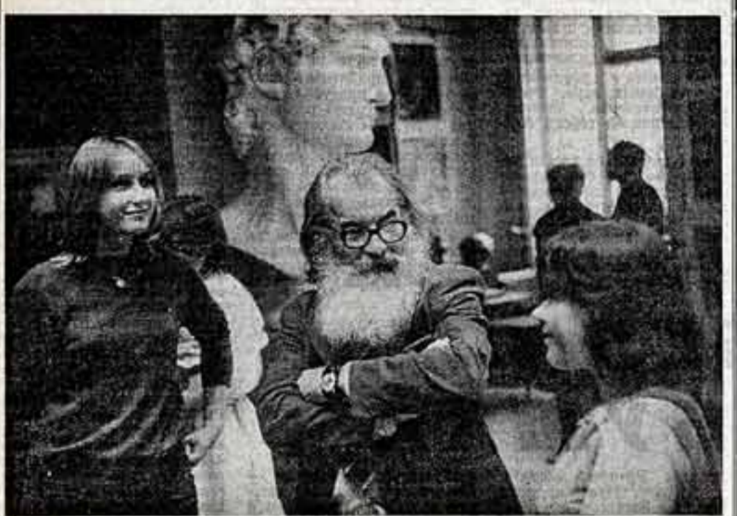
Экзамен — праздник

З. ПАСЫНКО, народный артист РСФСР, главный режиссер Пермского театра оперы и балета, профессор. — Меня радует страстный талант Д. Канчели, объединившего вокруг себя талантливых композиторов, режиссеров, солистов, его максимализм и творческие критерии. Я захожу под впечатлением от спектакля «Музыка для жизни» Г. Канчели. Этот спектакль, осуществленный Р. Стурца, мне кажется, сыграл большую роль в дальнейшем развитии оперного жанра. Он синтезирует режиссуру, творческий поиск музыкантов, художников, солистов, богатство исполнительской культуры хора и оркестра. Итам Театр имени З. Палиашвили возвращается к вершинам. Но путь только начал, впереди предстоит новые поиски, новые открытия. Иа МУХРАМИ, наш соб. корр.