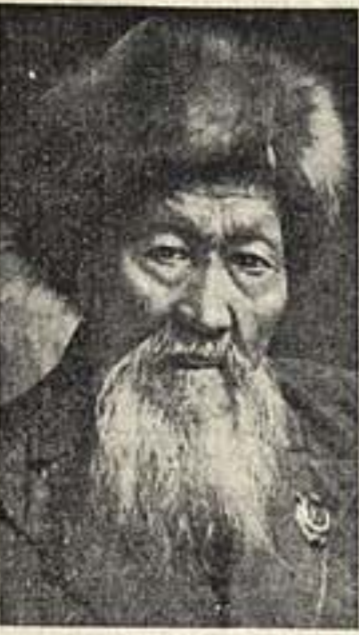
Лауреат Сталинской премии Джамбул Джаббаев

После войны Джамбул перебрался в все классы народов СССР, являлся заместителем редактора советского журнала «Дружба народов». Он активно работал в области поэзии и прозы. В 1949 году он стал лауреатом Сталинской премии.