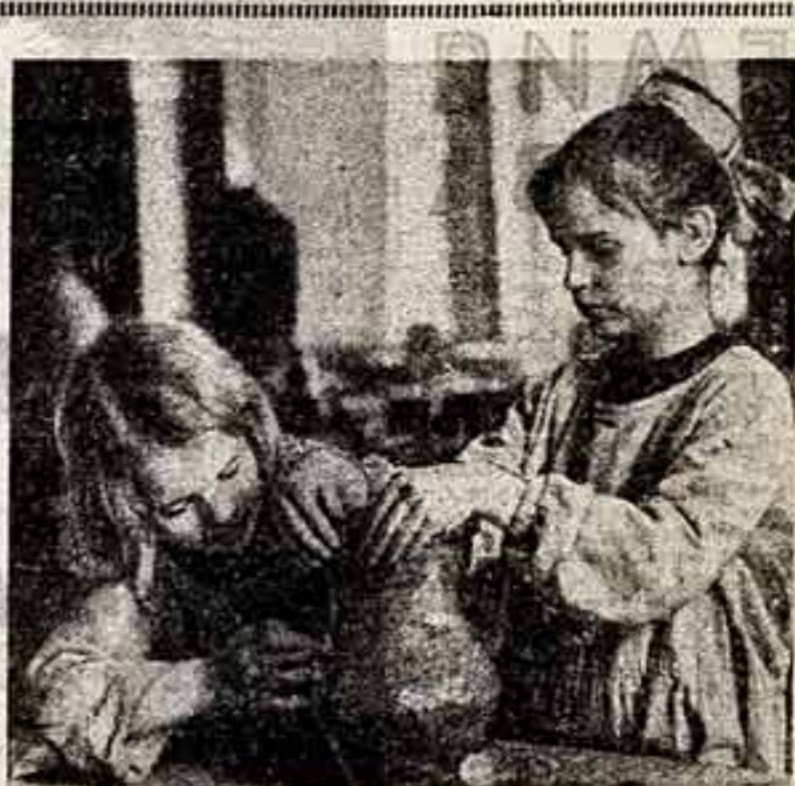
Юные скульпторы неадекватного искусства в Берлинском дворе готовят ко Дню освобождения подлинный немцы.