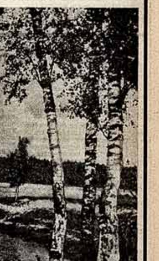
И ТОГДА в шум тверских сосенки лесов и на берегах реки Сестры, где жил, бродил и работал Чайковский...