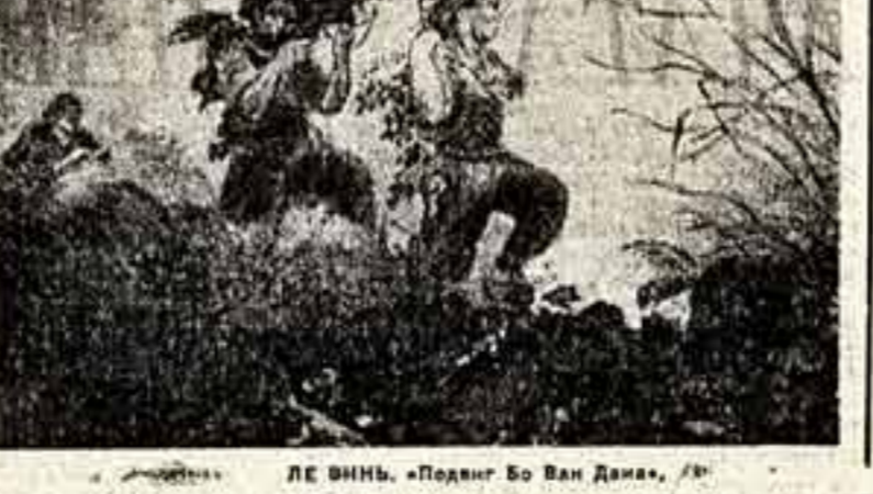
ЛЕ ВИНЬ, «Подвиг Во Ван Дана».