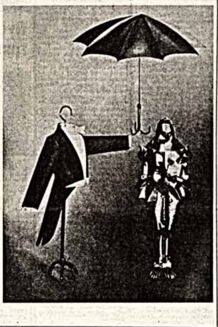
Иллюстрация из журнала «Советский театр».

Мы встретились с Юрием Петровичем Любимовым в день рождения Театра на Таганке. Театру как раз исполнилось 28 лет. Может быть, поэтому маленький столик в кабинете худрука был застелен узорным полотенцем, а на нем пасхальный кулич, свежие огурцы и банка меда!