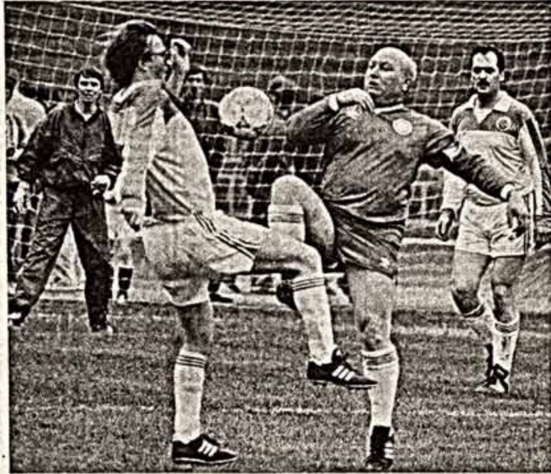
обронил 2 мая перед футбольным матчем между правительствами Москвы и России вице-мэр столицы Юрий Лужков.