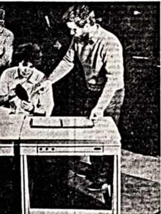
Диалогные работы выпускников кафедры системной и прикладной дизайна...