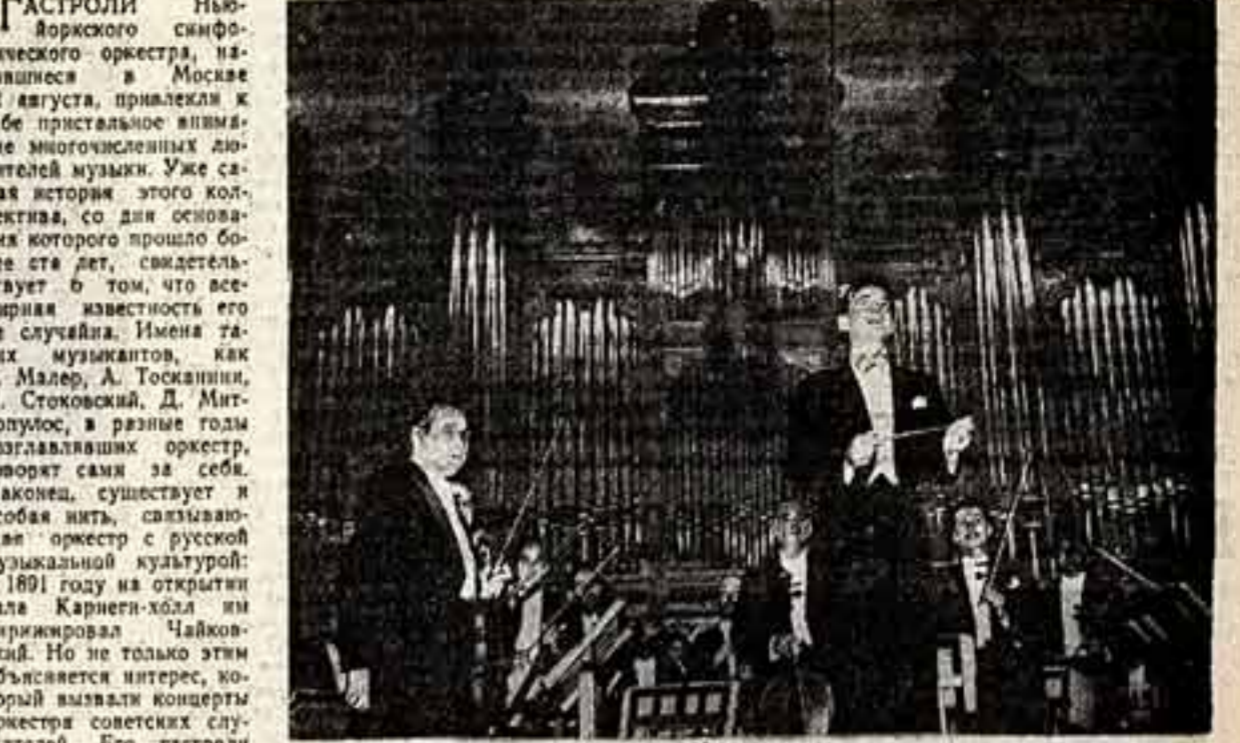
В Большом зале Московской государственной консерватории имени П. И. Чайковского. Леонард Бернштайн и артисты оркестра отвечают на приветствие слушателей.