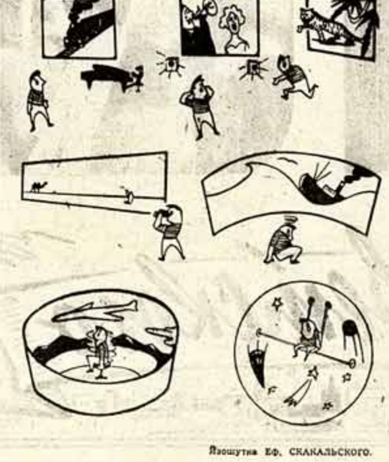
Иллюстрация Е.Ф. СКАНАЛЬСКОГО.