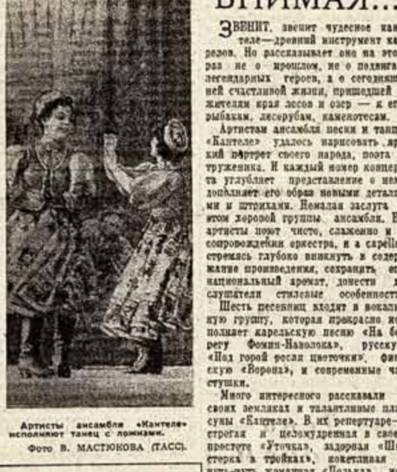
Артисты ансамбля «Кантеле» исполняют танец с ложками.