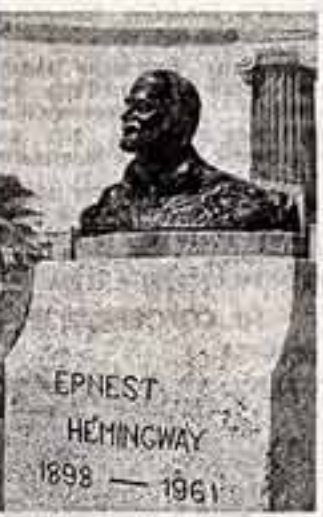
Памятник Хемингуэю в поселе Кохиар, откуда писатель выходил в море вместе с кубинскими рыбаками.

В годы народной власти усадьба, где жил писатель, превращена в его дом-музей.