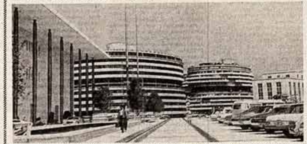
Один из современных музеев района столичной США.