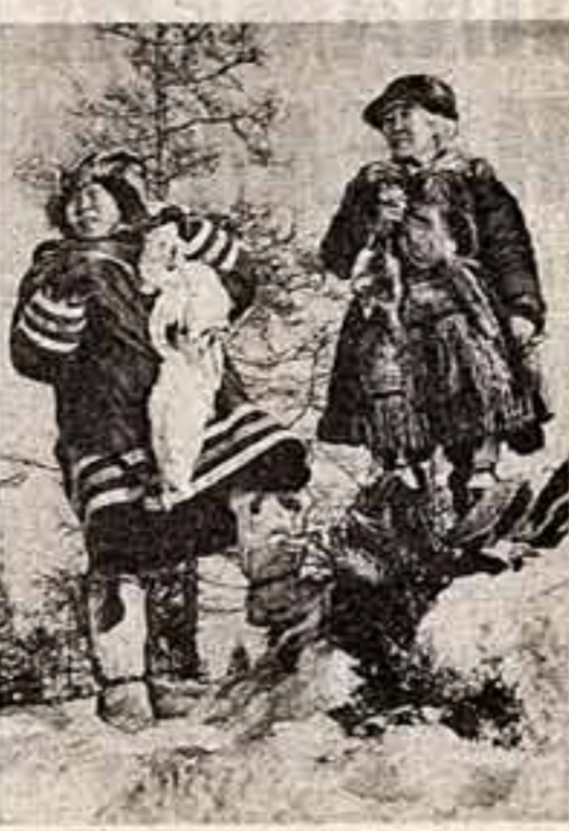
Сейчас во Владивостоке развернута выставка «Край нашекский». Десять лучших фотографий Юрия Муравина рассказывают о мыслях дне Дальнего Востока. В. СТИГЕВ.