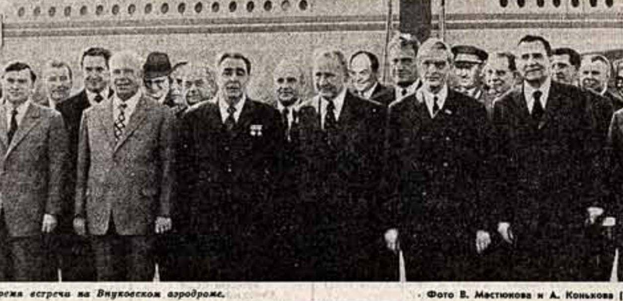
Во время встречи на Внуковском аэродроме.

В ходе визита Л. И. Брежнев и Ж. Помпиду обсудили вопросы сотрудничества в различных областях культуры, науки, искусства, спорта, туризма и других сферах общественной жизни.