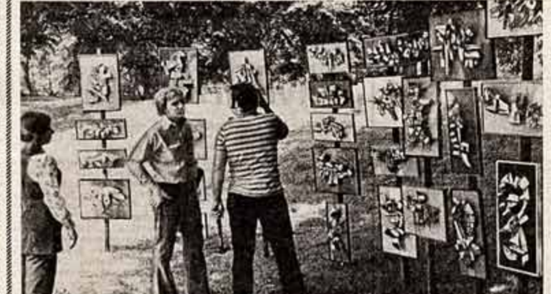
Две фотографии из жизни сегодняшней Америки. Вашингтон, площадь перед Капитолием. Американский художник вместе с коллегами готовит и распродает свои картины.