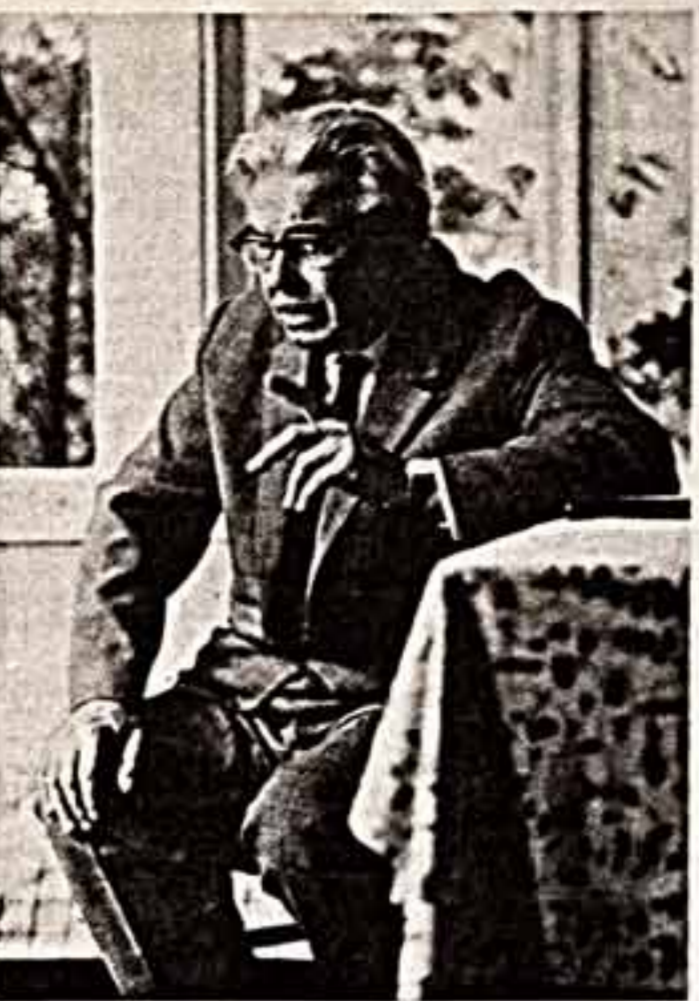
Чемпион мира вроде бы не возражал против матча с ним, но выставил условия, ставшие поводом для скандала...