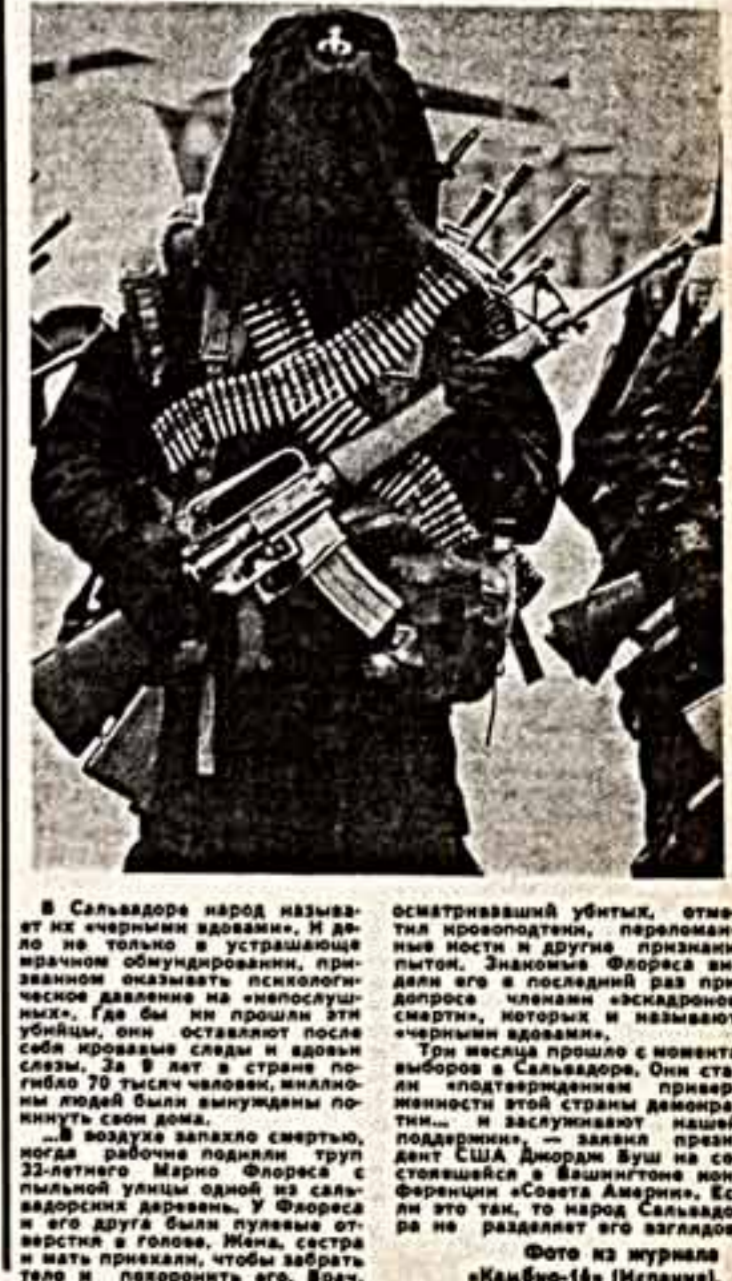
Фото из журнала «Камбио-16» (Мелани).

В американском городе Форт-Уэрт (штат Техас) открылся международный конкурс пианистов имени Ван Клайберна.