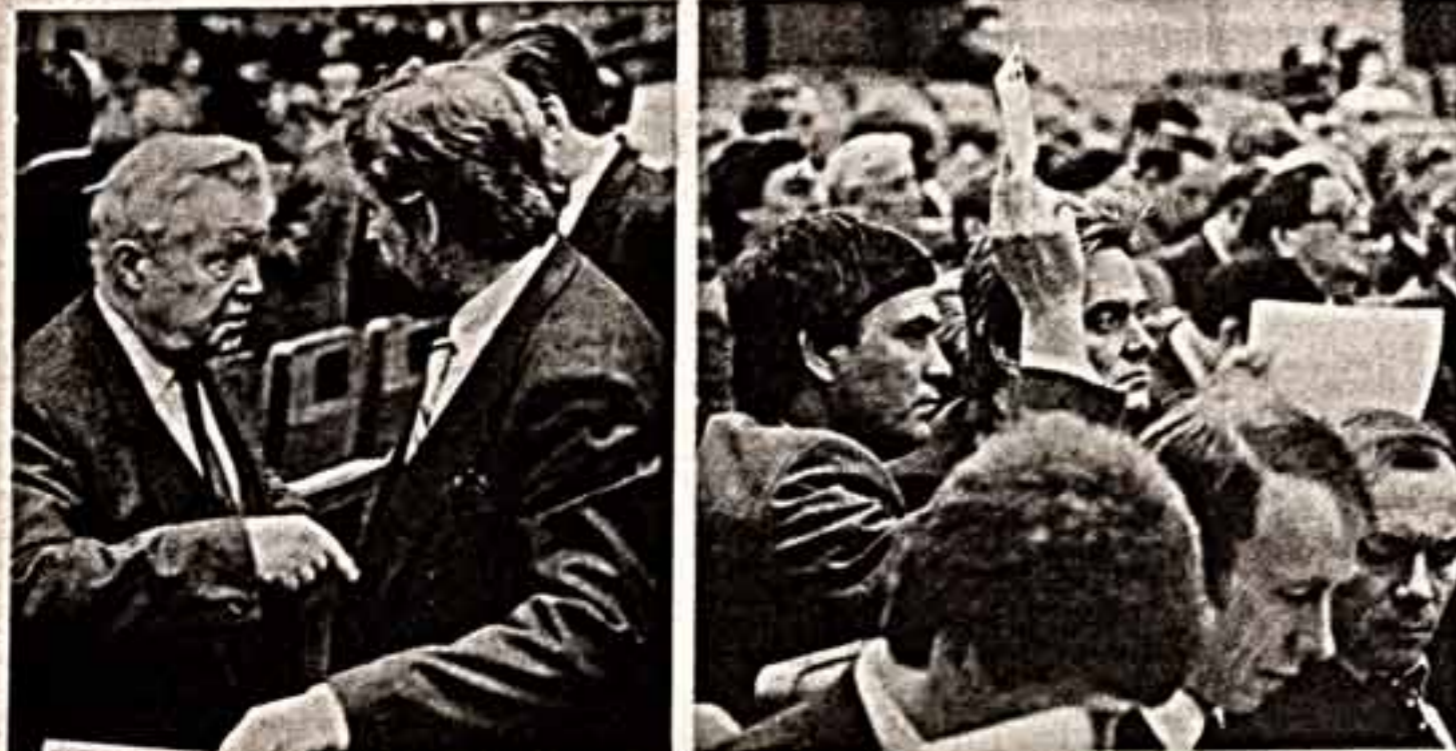
Москва, Съезд народных депутатов СССР.