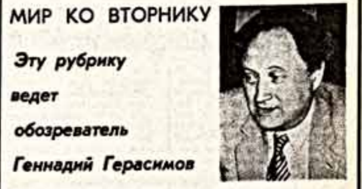
Мир ко вторнику. Эту рубрику ведет обозреватель Геннадий Герасимов.