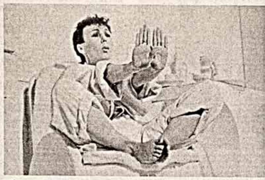
В Японию и в Бам был Катлла А в Риме был бы Хокусусам А вот в России в тот самый Что вот в Японию — Катлла А в Риме — чистый Хокусусам Был бы

Спектакль, поставленный ровно в центр эфирной, и оказался центральным несомненно смотра, смысл которого — не в единстве, а в сопряжении. Приведем в пояснение короткий стих Д. Пригова: