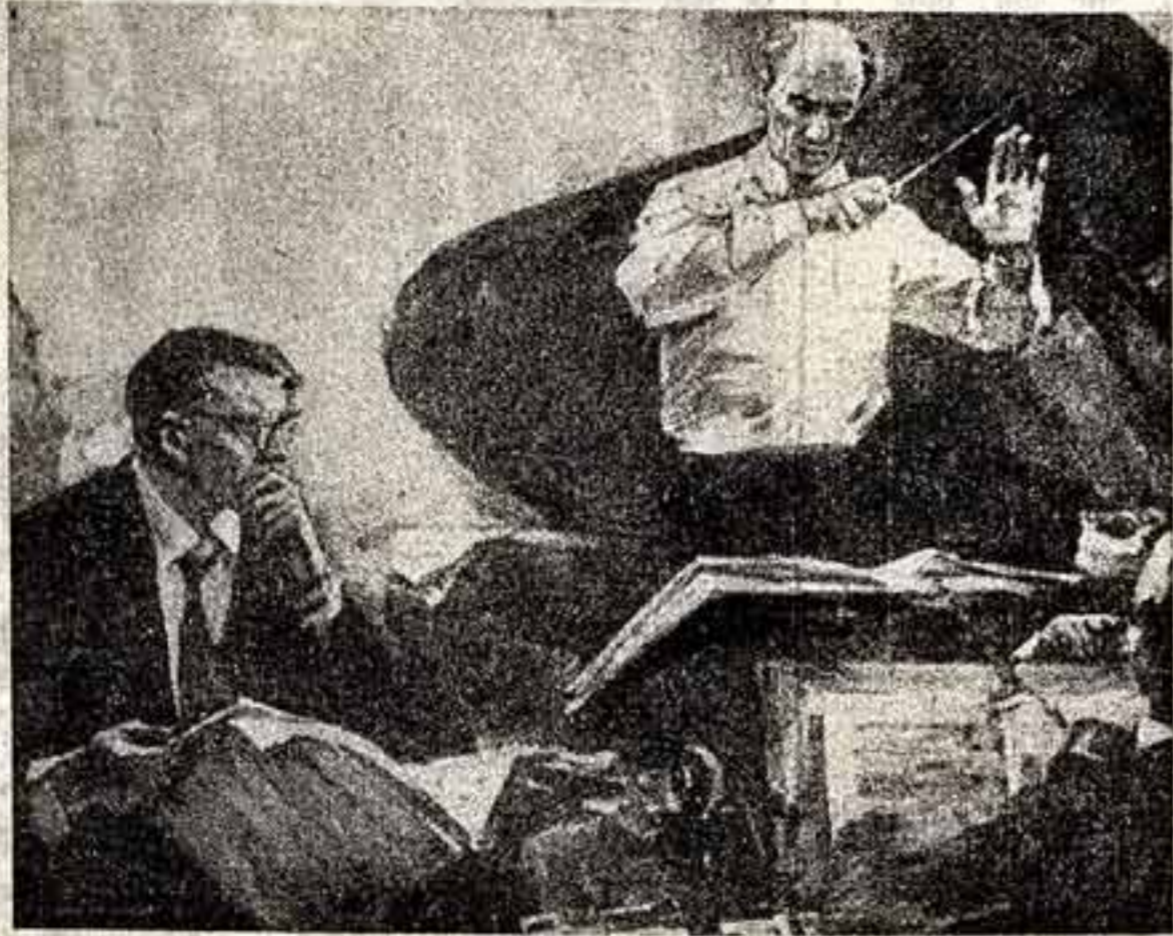
О. Ломанин (Ленинград). «Шостакович и Мравинский».