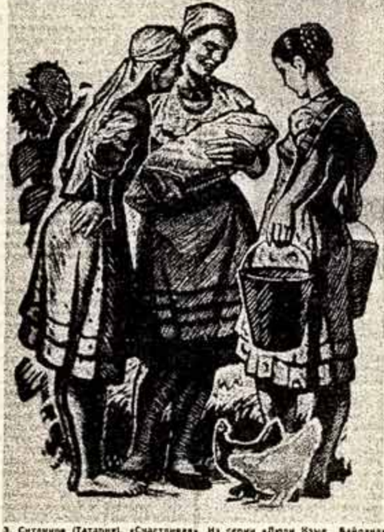
Э. Сидников (Татарки). «Счастливая». Из серии «Люди Ижмы Вайрала».