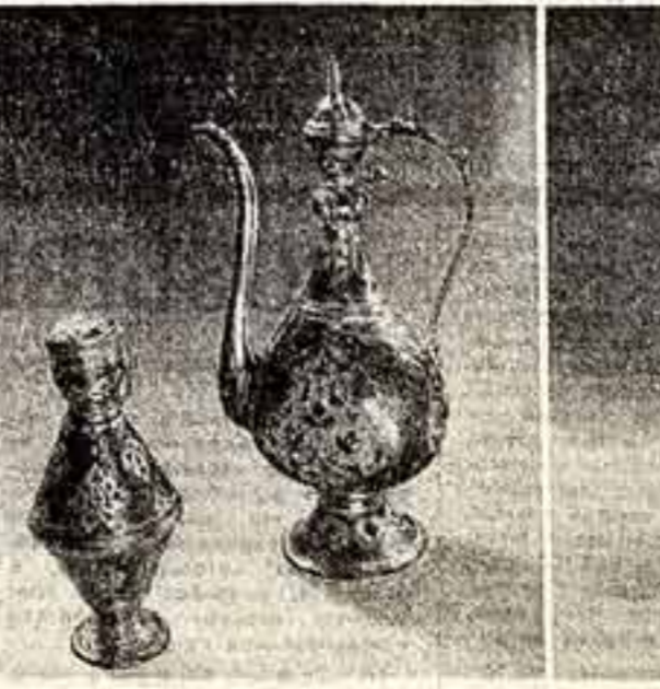
Дагестан, Нубачи. Мастера-художники высшего мастерства и поэзия страны гор! Поэзия металла — искусство по серебру, виртуознейшая гравировка — на весь мир прославлены кубачинские золотушники.