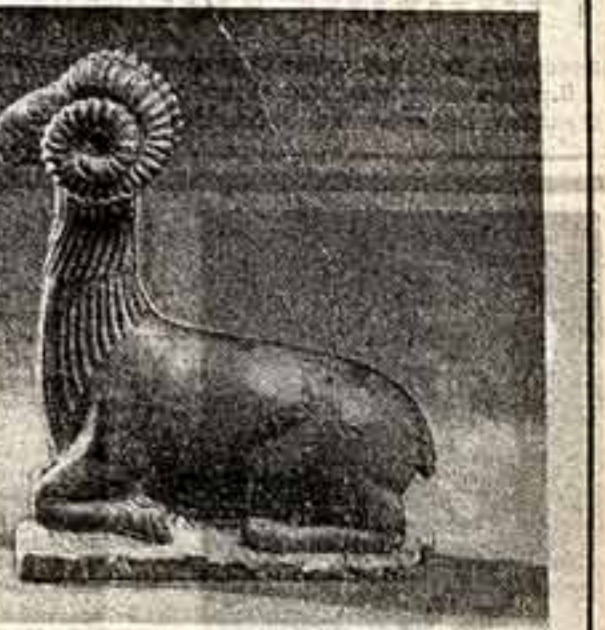
В раздолых тувинской степи, на берегах истоков Енисея, в отрогах гор, в тайге и на пастбищах — простор художническому чувству. Потувинский — «Штер, барыгыг» — «Привет, товарищи!» — привет вам, мастера Тувы, за ваше искусство.