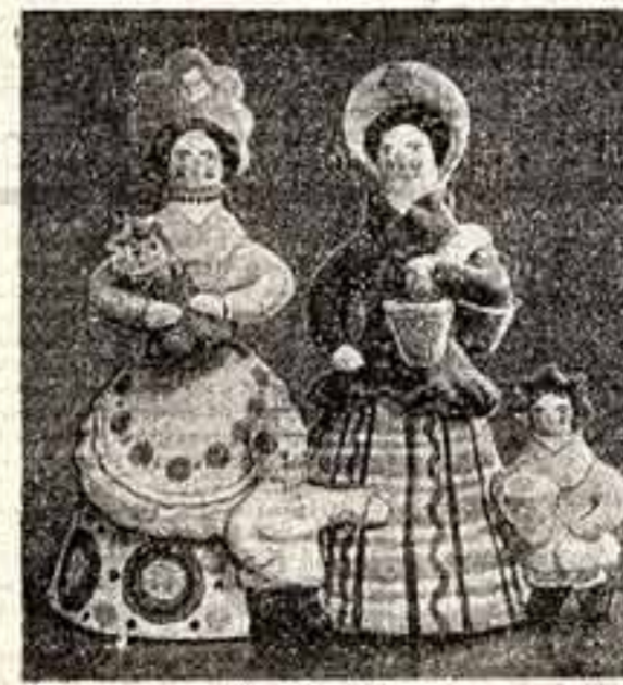
Этот искусство ласково называют «дымной» — дымковская расписная игрушка, русская национальная яркость, затейливый красочный сочинник мастериц из северного края.

Многоцветие красок в музыкальном языке России. Песни северя — размеренные, раздумчивые.