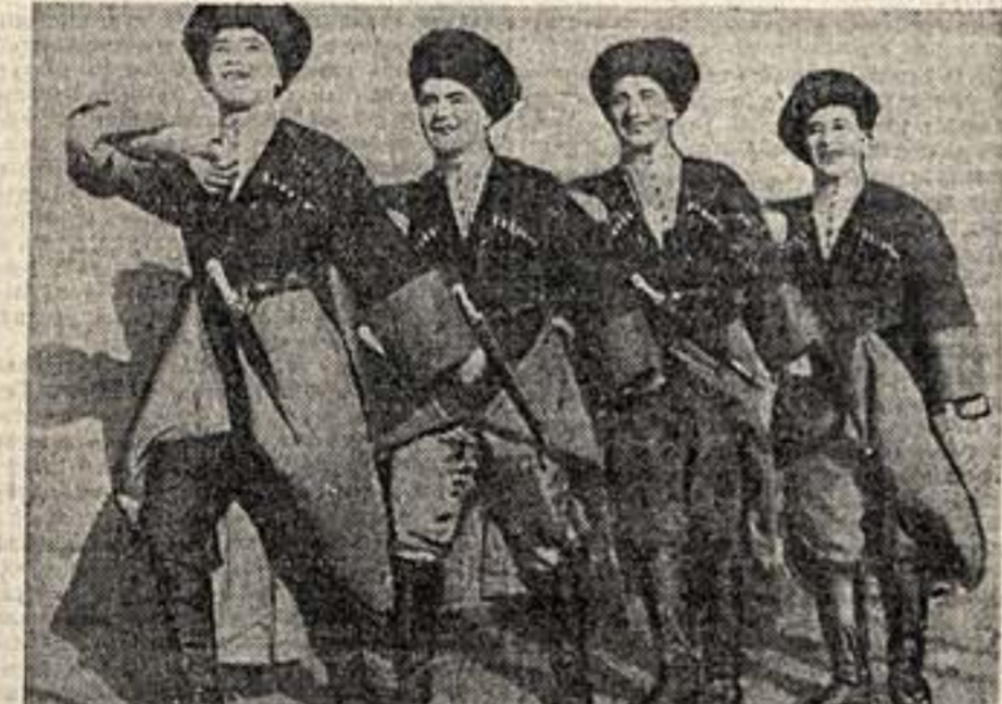
Новая программа в Госцирке. Дагестанцы из аула Цовкоро.

Поиски этого нового стиля особенно сильно чувствуются в юбилейной программе первого Госцирка. На манер пришел режиссер и художник. Это не гастроли, не случайное содружество, а серьезная творческая коллективная работа. Имена этих людей — Орский и Ридлин. Художник авло одла всех участников представления. Соединил в Москву из разных республик артисты быть может в первый раз в жизни