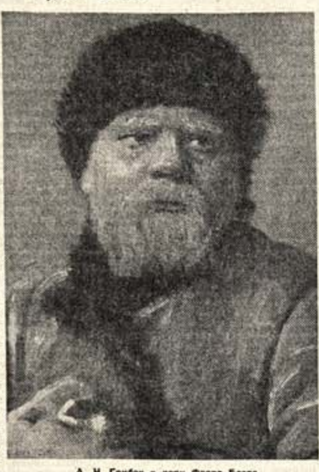
А. Н. Грибов в роли Фрола Баева