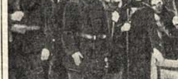
«На берегу Невы» в Малом театре. 3 акт, 9 картина: В райком партии.