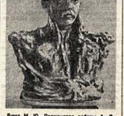
Бюст М. Ю. Лермонтова работы А. С. Голубкиной (бронза)

Особенность музея Голубкиной в том, что здесь показывается не только ее искусство, но и технология ее работы. В музее проводится большая и весьма сложная работа по переводу в бронзу глиняных скульптур Голубкиной, часть которых уже начала разрушаться. Отлита в бронзе скульптура работы М. Ю. Лермонтова.