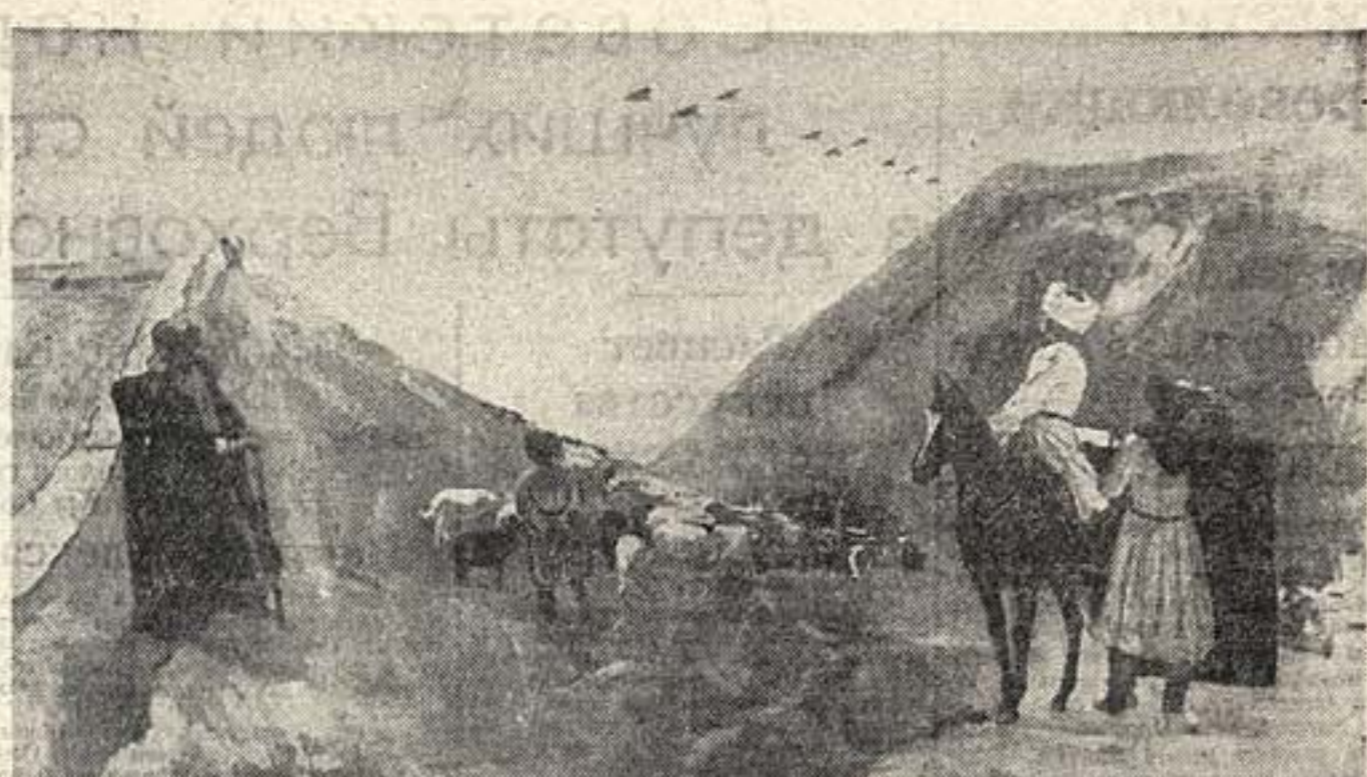
С. В. Герасимов. «Кавказ». Панно для санатория Наркомтяжпрома в Сочи.

Народ стал полноправным властителем песенности, созданным человечеством. Он стал творцом того искусства, к которому стремился Лысенко. Именно это и обусловило прочную связь украинского советского композитора с творческим наследием Н. В. Лысенко.