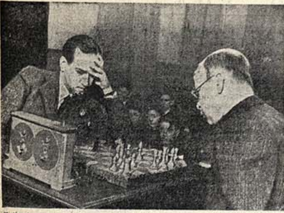
В клубе мастеров искусства происходит интересный шахматный матч между скрипачем Давидом Ойстрахом и композитором Сергеем Прокофьевым. На снимке — первая партия матча.