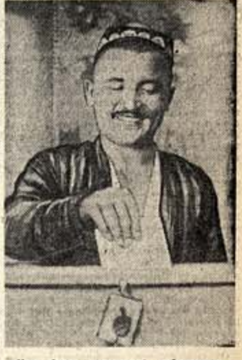
«Как будет голосовать избиратель». Кадр из звукового инструментального фильма. Режиссер С. Юткин

Заслуженная артистка республики орденосица М. П. МАКСАКОВА