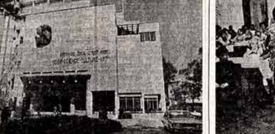
В Дели состоялась торжественная церемония открытия Дома советской науки и культуры. В новом Дворце советско-индийской дружбы созданы все условия для проведения больших выставок, концертов, лекций, демонстраций кинофильмов, а также изучения русского языка.