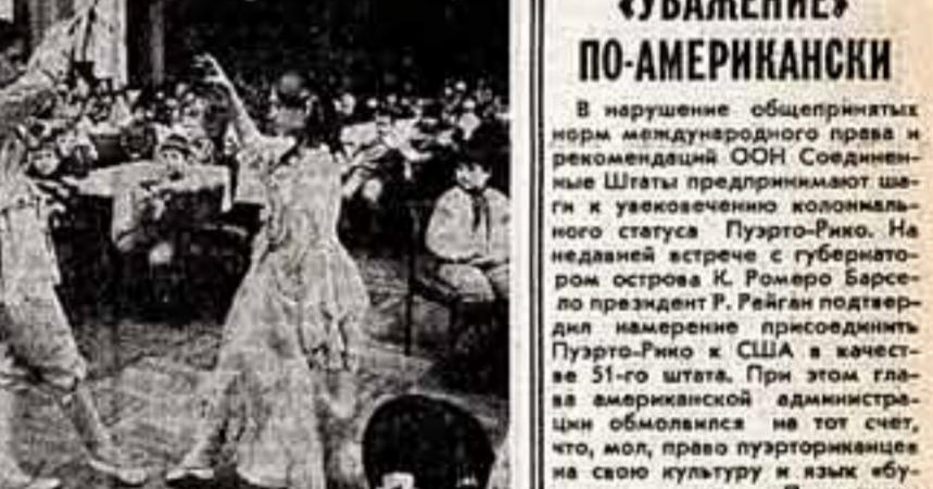
Концерт для дошкольников и младших школьников, устраиваемые силами музыкально-обережных детей, — добрая традиция в городе Лейпциге. В прошлом году здесь было проведено 80 таких мероприятий, превращенных развлекательных и воспитательных интересов к музыке с самых юных лет.