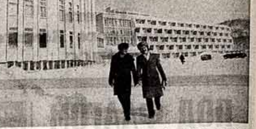
ПРЕВРАТИМ СИБИРЬ В КРАЙ ВЫСОКОЙ КУЛЬТУРЫ

беседы за «круглым столом». Одним из важнейших условий интенсификации учебного процесса является развитие и совершенствование групповых и индивидуальных форм работы со слушателями. Организованы факультативные занятия по вопросам литературы и искусства, истории советского общества, мастерству публичного выступления, методике социологических исследований. Академия стремится соединить учебный процесс с практикой коммунистического строительства, чтобы за годы пребывания в ней слушатели и аспиранты не отря-