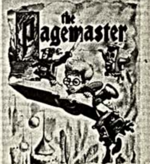
Интерес к семейному кинематографу, и мы вместе со своими детьми, как всегда до праздника, отправимся в кинотеатр. М. БАДМАЕВА. © Кадры из фильма "Андрэ" и "Повелитель страниц".

пущим семейным фильмом в Америке. Маленький мальчик, оказавшись с помощью Повелителя страниц в удивительной стране кинематографа, обретает веру в себя, становится смелым и храбрым. Рекордность распродажи билетов на этот фильм была предопределена своеобразным изобразительным языком - сочетанием игрового и анимационного юннатого языка и участием суперзвезд Голливуда. Остается надеяться, что отечественные проектанты прова-