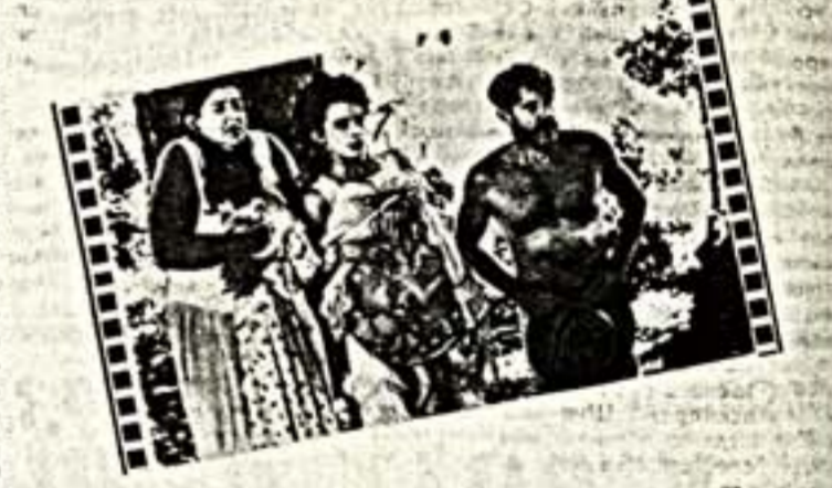
Кадр из фильма "Дорога на Валайял".