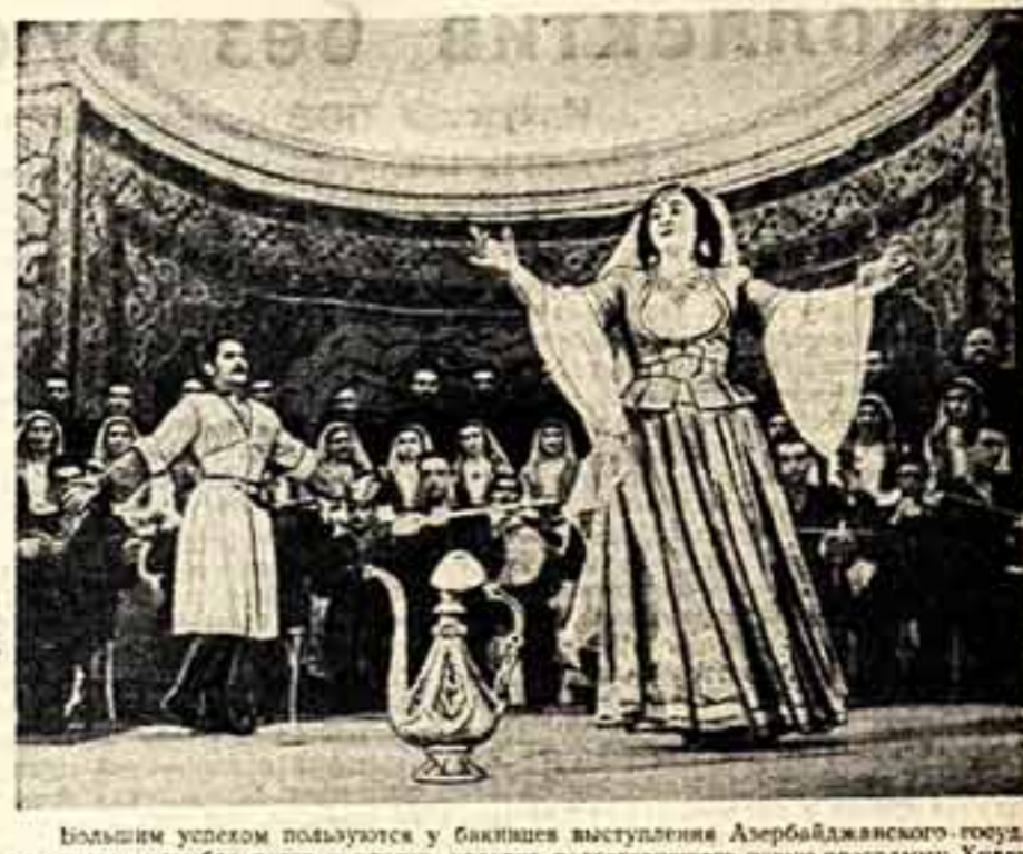
Большим успехом пользуются у бакинцев выступления Азербайджанского государственного ансамбля песни и пляски.

«Нам возмущает в том, — говорит Армандо Гонсалес, — что наши силы, силы народов в настоящее время оказываются в стороне от главного международного фронта мира — от борьбы за мир и свободу в странах Советского Союза, ведомой гением Сталина».