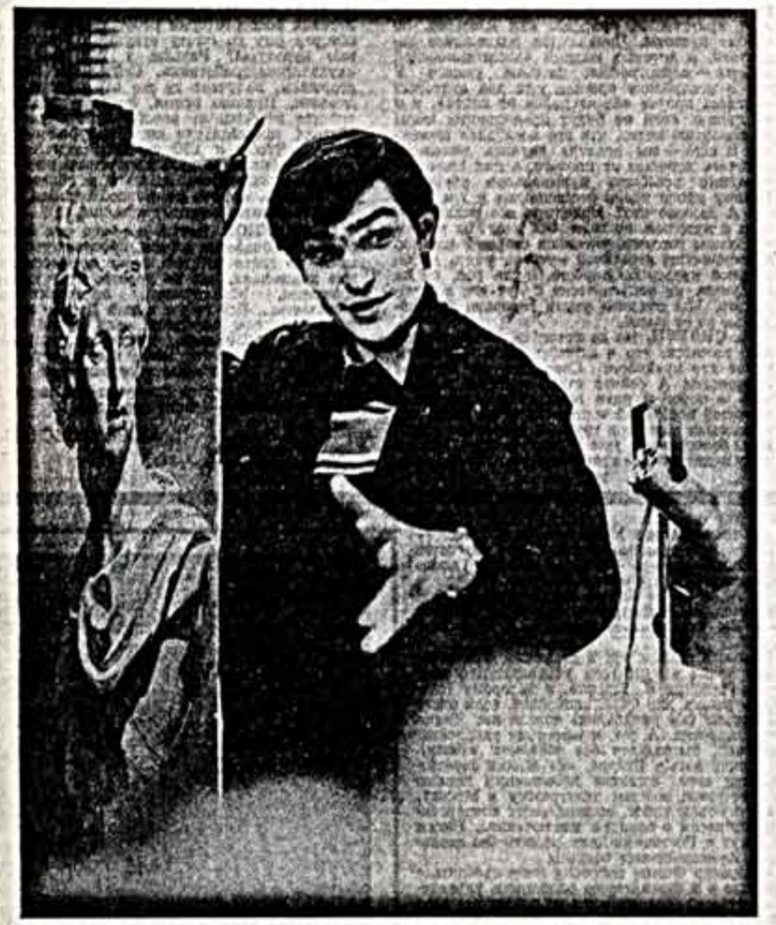
В. КОРНЕЕВ. «В мире прекрасного». (Свердловский сталочный завод имени Владимира Ильича Сергей Рабцевича).